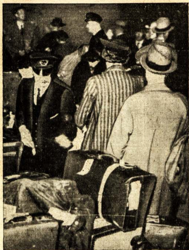
Suvenytų Valstijų ir kitų šalių piliečiai Londono stotyse laukia traikinio, kad pabėgti iš šio didmiesčio, nes atsitikime karo Londoną atkankytų nazių bombieriai.

Suaugusio žmogaus širdies normalus plakimas yra 70-72 kartus per minutę. Betgi jis labai daug priklauso nuo žmogaus jausmų pakilimo ar atslūgimo ir žmogaus amžiaus. Susijaudinęs žmogus paakstina savo širdies plakimą ir ji plaka daug smarkiau, gi esant ramiam ir miegant širdis plaka daug lėčiau. Lėčiausiai žmogaus širdis plaka miegant — 60 kartų per minutę. Naujagimio širdis plaka 130 kartų per minutę. O jau dešimties metų vaiko — 90 kartų. Apie 15 metų amžiaus jaunuolio širdis pradeda plakti normaliai, tai yra, 70-72 kartus. Į senatvę širdis vėl pradeda smarkiau plakti (Gal todėl daugelis žmonių senatvę pasijunta jaunesni? — Red.) ir siekia 80 kartų ir daugiau per minutę. Palyginus širdies plakimą su kitais gyvūnais matome, kad kuo mažesnis gyvūnas, tuo jo širdis smarkiau plaka. Pavyzdžiui, vidutiniškai imant dramblių širdis per minutę plaka 25 kartus, kupranugario — 26, arklio — 34, liūto — 40, šunies — 100, triušio — 120, ežio — 300, pelės 400, žvirblio — 800, kanarkėlės — 1,000.