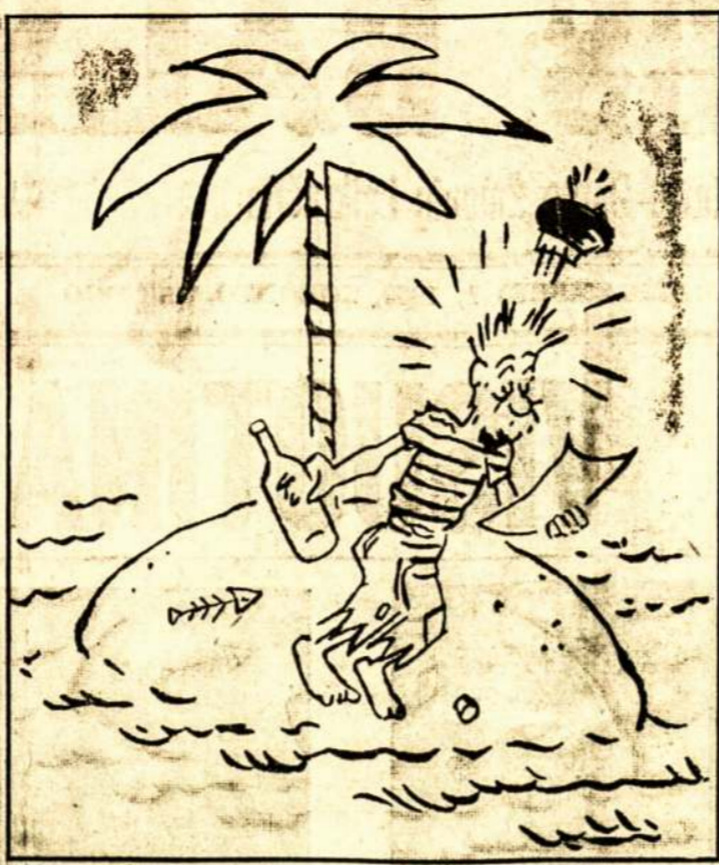
Japonijos imperializmo nuotaika po pasirašymo nepuolimo sutarties tarp Sovietų ir Vokietijos.

Anglų ir francūzų imperializmo taktika, pačių anglų žodžiais tariant, "monki biznis." Bet ne visada toks biznis gerai pasibaigia.