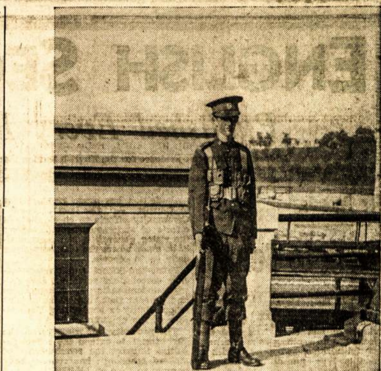
Kanados kareivis stovi sargyboje prie Wellando kanalo, kad ap-