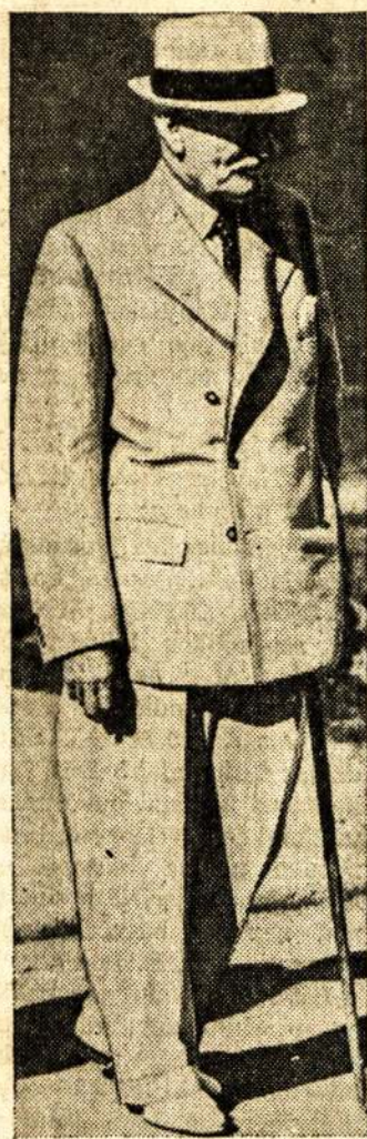
Trys didieji Lenkijos vyrai, prezidentas Ignace Mocicki, maršalas Edward Smigly-Rydz ir užsienio reikalų ministeris pulk. Josef Beck. Viso pasaulio žmo-

VARŠAVA, Rugpiūčio 31. — Valdžios atstovas pareiškė, kad slapta Dancigo nazių policija užėmė gelžkelio stotį ir iškėlė svaistiktuotas vėliavas.