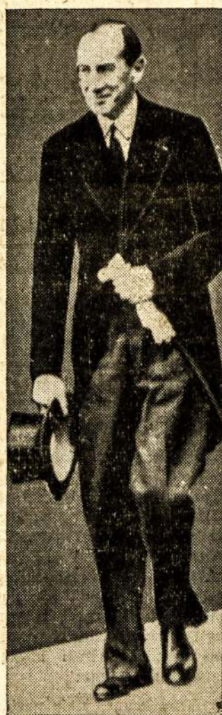
sileidimas spaudimui ir paaukavimas Hitleriui Dancigo ir kordoriaus Lenkijos respublika pradžudytų, kaip kad pražudė Čekoslovakiją atidavimas Sudetus.