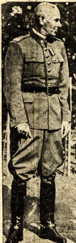
nės stato klausimą, ar jie atlaikys spaudimą iš Čemberleno, Daladje ir Hitlerio pusės. Turėdami prieš akis Čekoslovakijos pamokas, turėtų žinoti, kad nu-