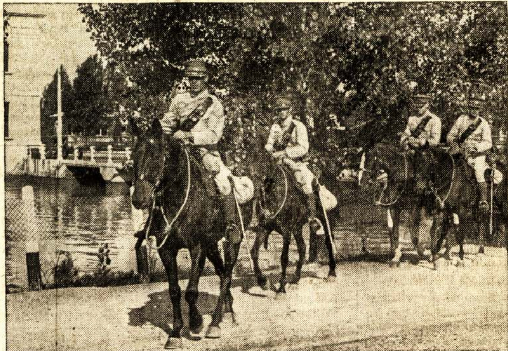
Europos krizis paliečia ir Kanadą. Kanados valdžia, norėdama apsaugoti susisiekimą ir elektros jėgą nuo sabotažo, buvo priver-

OTTAWA, Ont. — Rugpiūčio 31. — Ministeris pirmininkas kviečia kanadiečius užsilaikyti šaltai.