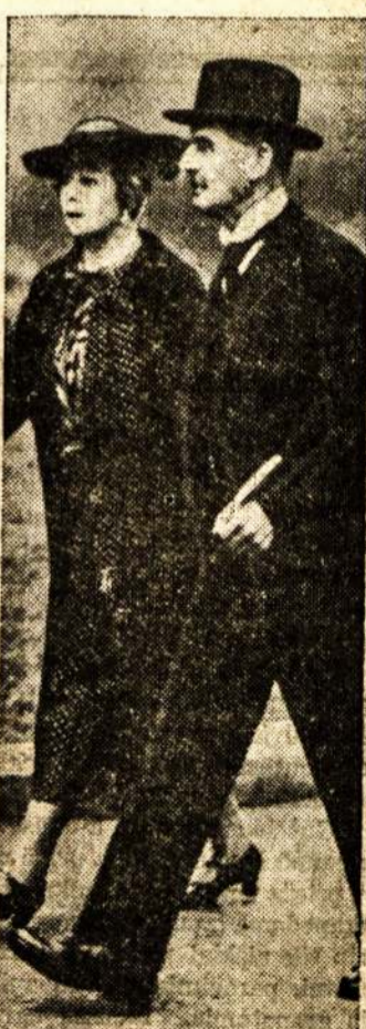
Neville Chamberlain, Anglijos ministras pirmininkas, su savo žmona. Nežiūrint to, kad karas kabo ant nosės, jis kasdien einą parką pasivaikščioti.

TORONTO. — Iš priežasties esančios dabartinės pasaulinės padėties atsaukiama unijstų ir bedarbių konferencija, kuri buvo ruošiamą Toronte rugsėjo 27-28 dienomis, vadovybėje Toronto Distrikto Darbo Tarybos.