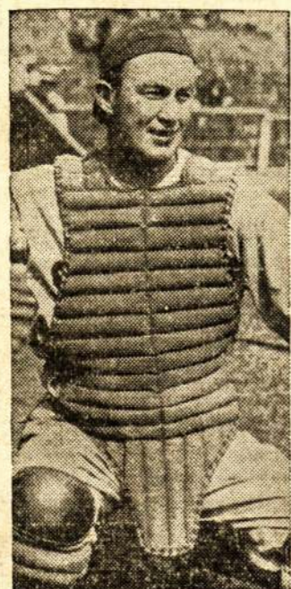
SOMETHING LIKE A RECORD Gabby Hartnett, playing manager of the Chicago Cubs since July of last year, holds all National League endurance records for catchers. No other backstop in 63 years caught as many games; he caught 100 or more games for 12 years, eight of them consecutive years; both are records. He has been No. 1 Cub catcher for 17 years.