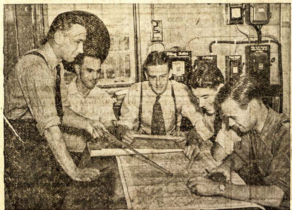
Royal Canadian Air Force rekrutai Reginoj mokinami skaityti žemlapį. Dabartiniu laiku Kanada del Anglijos. Ar sius kitas dar- zmlapį. Dabartiniu laiku Kanada del Anglijos. Ar sius kitas dar- zmlapį. Dabartiniu laiku Kanada del Anglijos. Ar sius kitas dar-

del Anglijos. Ar sius kitas dar- zmlapį. Dabartiniu laiku Kanada del Anglijos. Ar sius kitas dar-