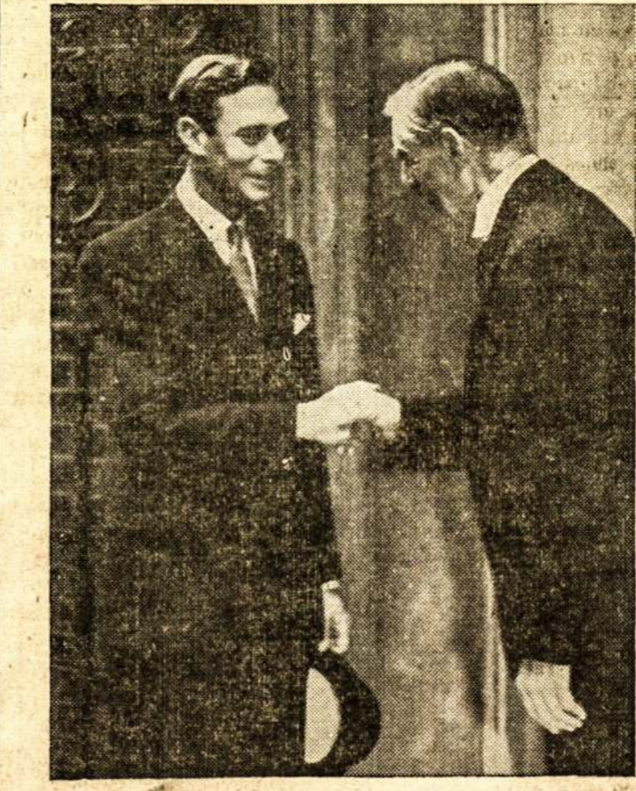
Laikraščiai sako, kad Anglijos karalius padarė negirdėtą atsitikimą Britų imperijoje, kuomet jis atvyko pas ministerį pirminką Čemberleną pasiteirauti, kaip dalykai stovi, vietoj to, kad šaukti pas save Čemberleną. Jis norėjęs sutaupti jo laiką.

Boykach & Boykach Real Estate Agent Parduodame ir išrenduojame namus ir farmas. Išsklektuojame rėndas. Kas turite tų reikalų, kreipkitės pas mus. Daugeliui lietuvių esame patarnavę. 133 GOREVALE AVE. Ofiso 429 ADELAIDE ST. W., TORONTO