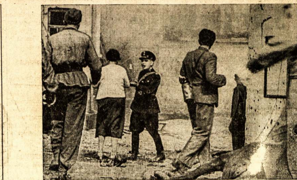
Scena po vokiečių oro atakos ant lenkų miesto. Policininkas stengiasi nuraminti besiblaškančius žmones. Tėmytojai sako, nazijų orlaiviai bombardavo ir nemilitarines vietas.