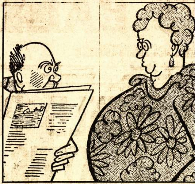
Žmona: "Kur tu buvai per eitą naktį?"

Darbo žmonės turi stovėti už pašalinimą fašizmo pavojaus visur, kur tik jis grumojas. Todėl reikalinga kovoti už demokratiją visur. Taika galės užviešpatauti tik demokratijai laimėjus, darbo žmonių jėgoms paėmus viršų. Tik darbo žmonės neturi noro grobti kitų šalių žemes. Jeigu šiandien Vokietijoje būtų darbo žmonių valdžia, Vokietijoje užtektų visko. O jeigu ko neužtektų, kitos valstybės noriai padėtų. Vokietijos fašizmas, besirengdamas karui prieš kitas valstybes, sugrobė visus darbo žmonių turtus ir suliejo juos į ginklus. Štai kodėl šiandien Vokietijoje trūksta maisto ir kitų reikalingų daiktų.