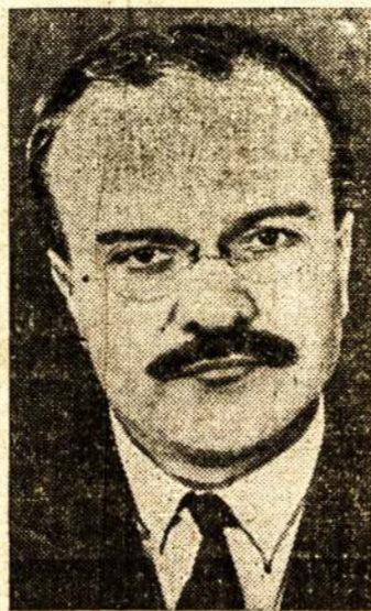
Sovietų Sąjungos premjeras ir užsienio reikalų ministras M. Molotovas ir Lietuvos užsienio reikalų ministras Juozas Urbšys, kurie šiomis dienomis Maskvoje

PARYZIUS, Spalio 16. — Vokiečiai vakarų frontan sutraukę 65 divizijas — 1,000,000 vyrų.