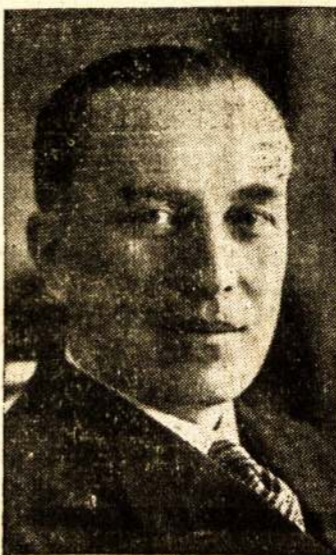
pasirašė apsigynimo sutartį tarp Lietuvos ir Sovietų Sąjungos. Pagal tą sutartį Vilnius ir jo kraštas su 600,000 gyventojų atiduodamas Lietuvai.