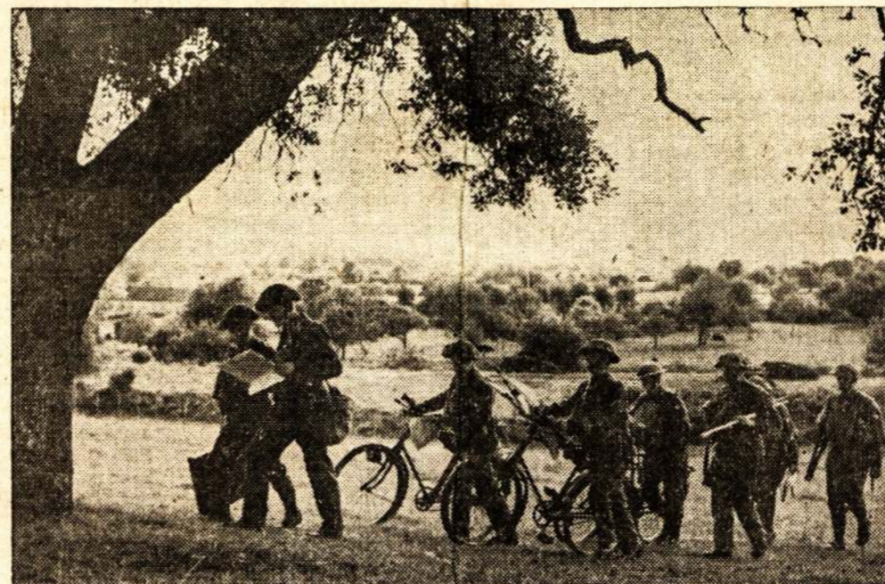
Būrys Anglijos dviratininkų kur nors Francijoj.

Laivą ir įgulą Sovietų Sąjunga internavo, bet manoma, kad laivas bus paleistas.