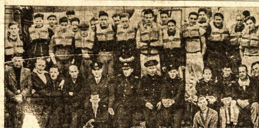
Anglų laivo Heronspool jūrininkai ant President Harding denio.