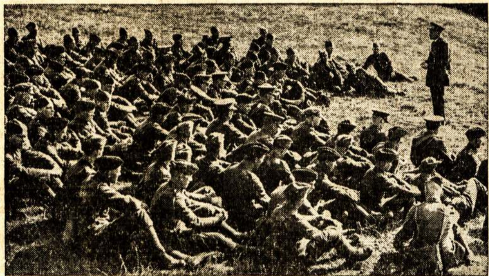
Kunigas sako pamokslą anglų kareiviams Francijoj.