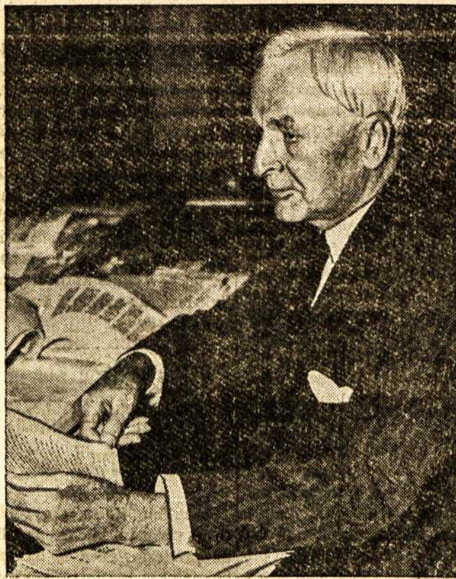
Suvienytų Valstijų sekretorius Cordell Hull, Europos karas tei-

Kaunas. — Lietuvos Savanorių Sąjungos Centro Valdyba išleido atsisaukimą į visuomenę, kuriame pabrėžusi 1920 metais Maskvoje pasirašyta su Sovietų Sąjunga taikos sutartimi nustatytas sienas ir nusistovėjusią gerą kaimynystę, sako: "Nesuklysimė sakydami, kad viena iš priežasčių, dėl kurių Lietuvoje esama gero jausmo Sovietų Sąjungai, yra ta, kad ši valstybė per visą eilę metų pastoviai priėjautė Lietuvai ir ją užstojo jos kovoje dėl savo tautinių idealų, kurie, Suvalkų sutartį paneigus, liko visiems mums atmintinu būdu neįvykdyti. Tvirtai tikime, kad realizuojant dabar bendrą sieną ir tiesioginę kaimynystę tarp Lietuvos ir Sovietų Sąjungos, įvykių dalyvių nebus užmirštas nė būtinas reikalas leisti mūsų tautai realizuoti ir save tautinį idealą, kurio įgyvendinimui yra, beje, ir tvirtas sutartinis pagrindas." Del santykių su antru didžiuju kaimynu, L.S. S. Valdyba sako: "Vakaruose turime kitą galingą kaimyną, Vokietiją, su kuria taip pat yra nu-