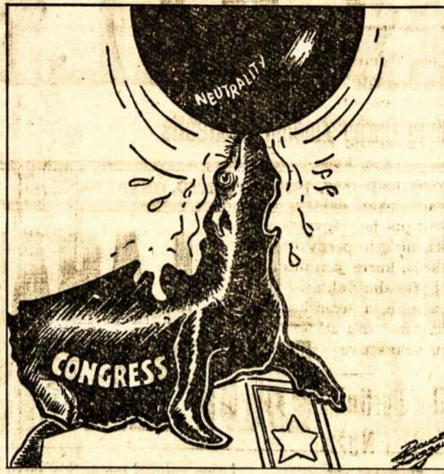
Ar užteks jam jėgų išlaikyti jį?

Kapitalistai su liaudies balsu nesiskaitė. Jie darė, kaip jie išmanė. Jie privedė pasaulį prie baisiausių skerdynių. Kitais žodžiais tariant, sėjo vėją. O kas vėją sėja, tas audrą piauna. Taip ir dabar bus. Karo nuvarginti žmonės ne vienoj šaly mėgins karo ruošėjų nusikratyti. Vokietijos darbininkai mobilizuojasi nuvertimui Hitlerio režimo. Be abejonės, Sovietų Sąjunga, atsitikime revoliucijos Vokietijoje, nestovės nuošaliai. Ji pareikalaus, kad kitos šalys nesiųstų kariuomenės Hitlerio šalininkams prieš darbininkus. Ji teiks paramą darbininkams, kaip kad teikė Ispanijos liaudies balsas, prieš nazius.