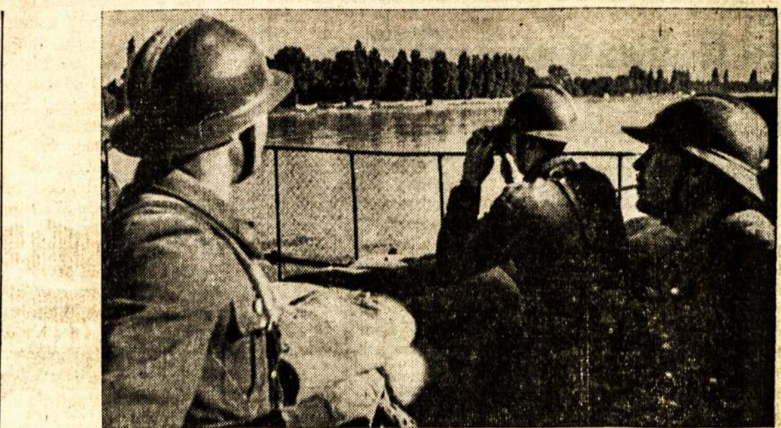
Francijos kareiviai tēmyja kitoj pusėj Reino upės.

Senai projektuojamo Sovietų Palonaijos statymą jau pradėjo. Tam didžiausiam pasaulyje namui jau statomas pamatas. Pa-