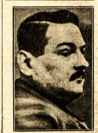
Draugas Ždanovas, Leningrado distrikto komunistų sekretorius. Kapitalistinė spauda buvo padėjusi ji ant juodo sąrašo — vis del to, kad Suomijos baltagvardiečiai "atlaiko" raudonarmiečių ofenzyvą.

I šį protestą atsakydama Rumunijos vyriausybė nurodo, kad ji Moscickį paleido neprasižengdama tarptautiniams neutralios šalies įstatymams, nes Moscickio paliosavimas buvęs reikalingas del jo pablogėjusios sveikatos nuo jam nepraprasto ir kenksmingo Rumunijos klimato.