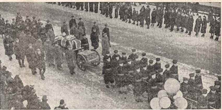
Kanados general-gubernatoriaus lordo Tweedsmuir' lavonas po tam tikrų ceremonijų Ottawoj

"Aš mieliai jums priduočiau mano vaiko tėvo fotografiją, bet