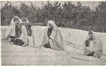
Baltos mārškos pasižarė labai populiarūs ir Kanadoj. Paveikslė matote būr kenadiečių ka-

eksploatuoti žibalo versmės Iš-imbajeve, Baskirijoje. Tai yra to "antrojo Baku" centras. Kita pavasarį buvo rasta naujų turtingų žibalo versmė.