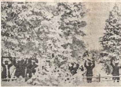
Kas per kraštas ta Suomija, galima matyti iš šio paveikslėlio. Pagal suomių paaiškinimą, čia esą raudonarmiečiai, pasidūdo į nelaisvę juos apsupus baltgvardiečiams. Galimas daiktas, kad tai raudonarmiečiai. Nei vieno

Kas liečia pagalbą, tai jos nesimato. Nei Anglija, nei Francija, atrodo, su tinkama pagalba nepribus. Kaip Anglijai, taip ir Kanadoje, leidžiami savanoriai, tik tie, kurie netinkami Anglijos ir Kanados armijoms, tai yra atmetami, arba nemilitarini amžiams. Kiek iš tokių kovotojų naudos, gali kiekvienas suprasti. Be to, Švedijos pareiškimas, kad nepraleis svetimą kraštų armijų, užkerta visas viltis.