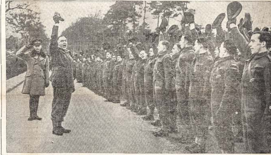
Pirmojo kontingento kanadiečiai Aldershot, Anglijoje, sveikinasi su karalium. Iš viso į Angliją išsiųsti trys kontingentai, sudarę visą diviziją. Ta divizija jau rengiama pasitinti į Franciją. Kanadoj yra rengiama kita divizija. Šias divizijas sudaro 100,000 karių, bet eina gandai, kad po rinkimų bus įvesta konskripcija. Nors kaip konservatyvų vadovas Dr. Manion, taip ir liberalai, spausdinamos.

Tarp Volgos ir Uralo upių, daugiau kaip vieno milijono kvadratinį kilometrų plote, yra surasta dideli naftos šaltiniai, kurie dėl savo gausumo pavadinami antruoju Baku. 1929 metais, Pirmos srityje, Uralo kalnuose, pirmą kartą pramonės tikslams buvo iš žemės išgauta naftos. Praslinkus trejiems metams, buvo pradėta