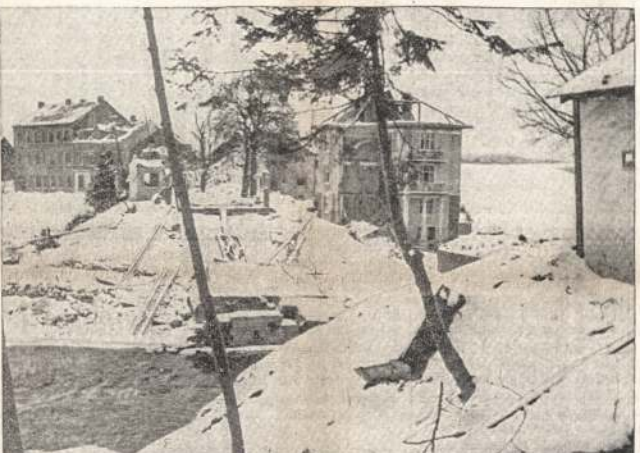
Scena iš vakarų fronto. Artillerijos sugriautas tiltas ir apgraužti pastatai "kur nors Francijoj". Maži mišiai vakarų fronte, sa-

Artinabais pasvarniui ūkininkai labai susirūpino, kad galų palkiti laukai neapsėti, nes nei vyrai, nei arklų nėra.