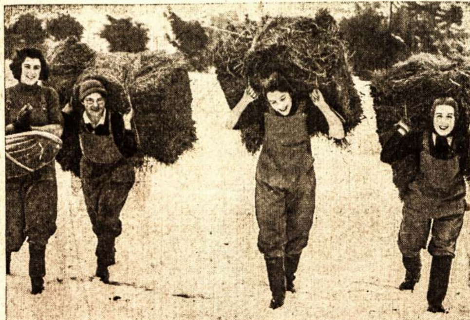
Anglijos moterys East Sussexoje. Moterys rengiamos įvairiems darbams, nes vyrai suimti į kariuomenę. Karui vystantis sunkės ir moterų padėtis, nes joms teks atlikti daug darbų, kurių pirmiau nedirbo.

Pranešama, kad dabartiniu laiku Turkija turinti 500,000 vyrų kariuomenę.