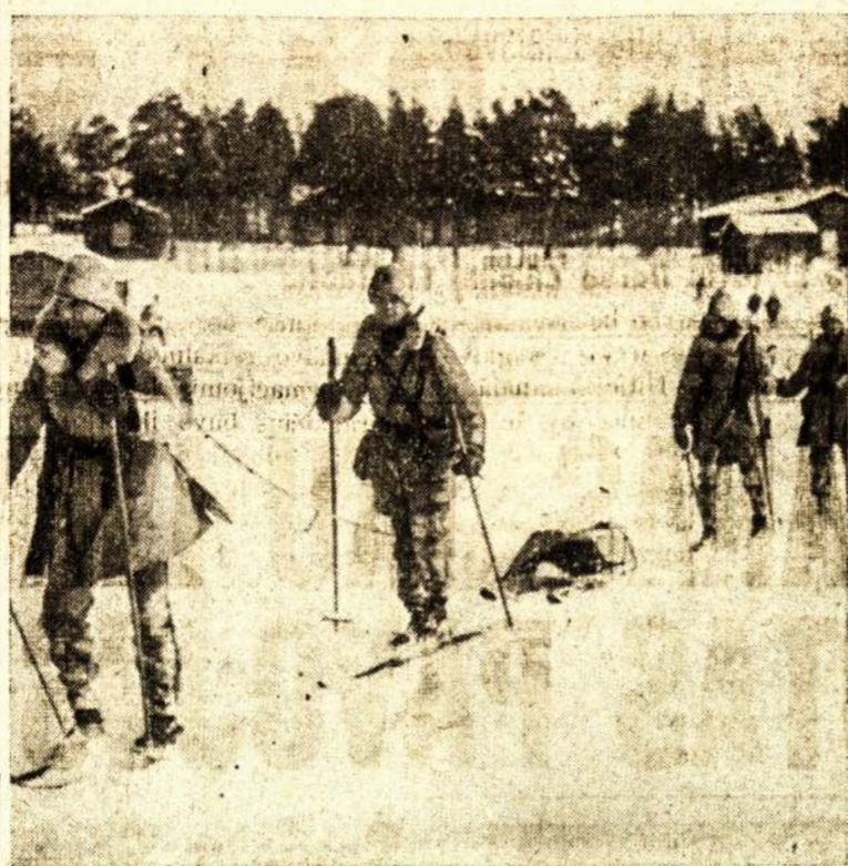
Svedijos kareiviai laike pratimų, daug kareivių, kurie puikiai čiuo Svedija, kaip ir Suomija, turi žia su slidėmis.

Prie to reikia atsargiai elgtis su vilniečiais. Reikia saugotis nuo tokios taktikos, kokia buvo naudojama Klaipėdoje. Kiek da-