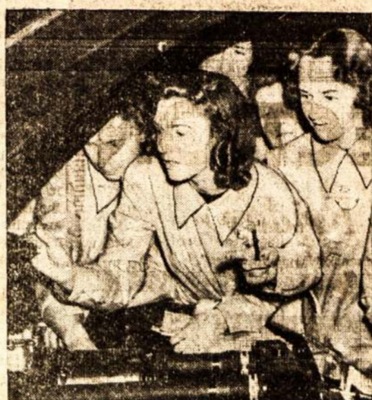
Toronto moterys ir merginos mokinais automobilių mechanizmo. Kanadoj, kaip ir Anglijoj, moterys rengiamos visokiems darbams, nes vyrus suėmusi kariuomenė "namų" darbus teks atlikti merginoms ir moterims, senoms ir jaunoms.