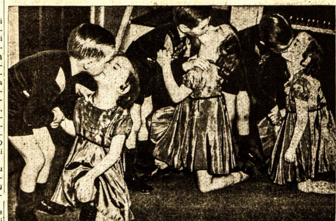
Bučkių, bučkių! Kuomet Van kių metų sukaktuves, New York trejukės, atvyko jų pasveikinti Ardoj trejukai minėjo savo penke, De Mellier mergaitės, taigpi — ir dar kaip.