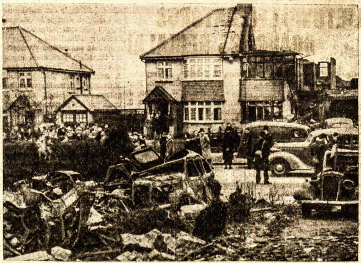
Netoli Croydono, Anglijoje, Wallingtono apylinkėse orlaiviu be kylant kaž kas atsitiko, kad jis nūrė į namo stogą ir su visu stogu nukrito kitą pusę namo. Lakūnas ir du namuose buvę žmonės buvo užmušti. Paveikslė matomas minimas namas be stogo ir orlaivio liekanos.

Pagaliau atsidūrė teisme. Ir nors ligi teismui buvo sugrąžinęs įstaigai jos išnaudotus pinigus, bet vistiek linksmybių užbaigimui gavo vienerius metus sąlyginio kalėjimo.