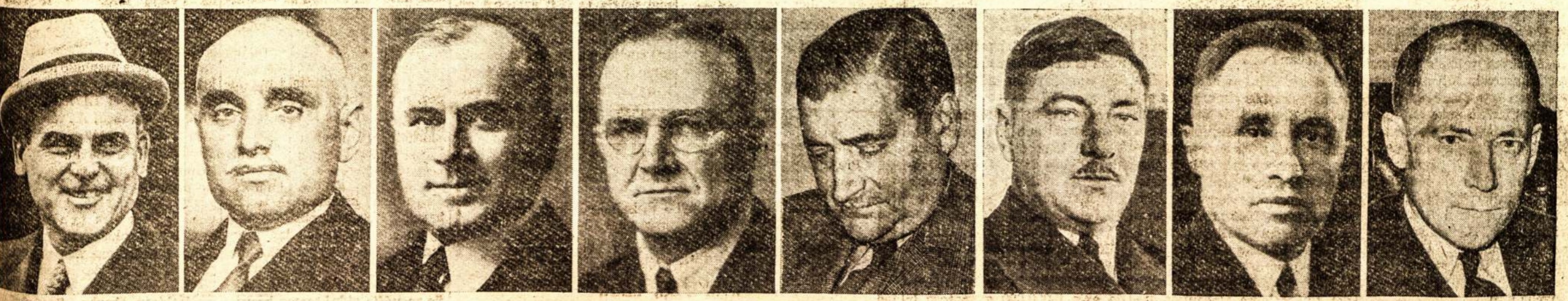
Hon. Clarence D. Howe Transportacijos Ministeris Hon. Pierre J. A. Cardin Viešųjų Darbų Ministeris Hon. Joseph E. Michaud Zuvininkystės Ministeris Hon. James A. Mackinnon Ministeris be Portfolio Hon. Ian Mackenzie Sveikatos Ministeris Hon. Charles G. Power Pašto Viršieškis Hon. James G. Gardiner Agrikultūros Ministeris Hon. Norman M. Rogers Apsigynimo Ministeris