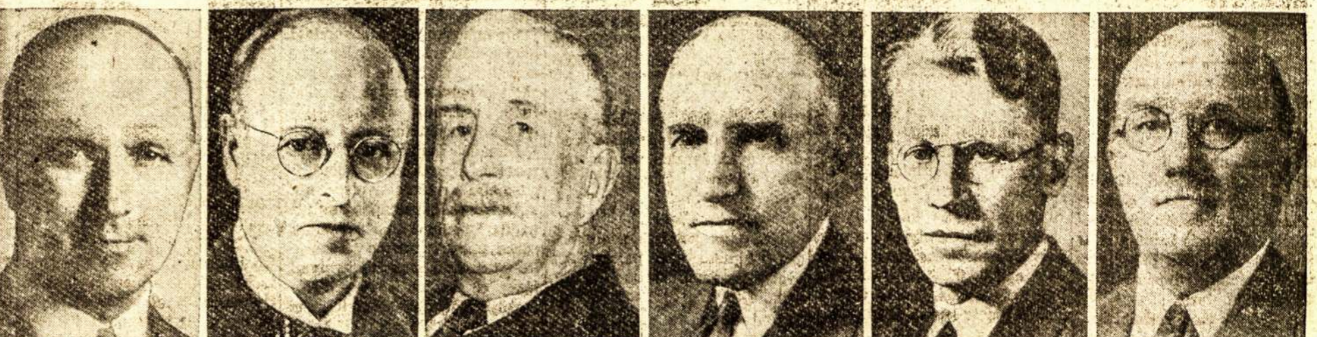
Hon. William D. Euler Prekybos ir Pramonės Min. Hon. Norman A. McLarty Darbo Ministeris Hon. Thomas A. Crerar Vidaus Reikalų Ministeris Hon. James L. Ralston Finansų Ministeris Hon. James L. Hsley Valstybės Įplaukų Minister. Rt. Hon. Ernest Lapointe Teisingumo Ministeris