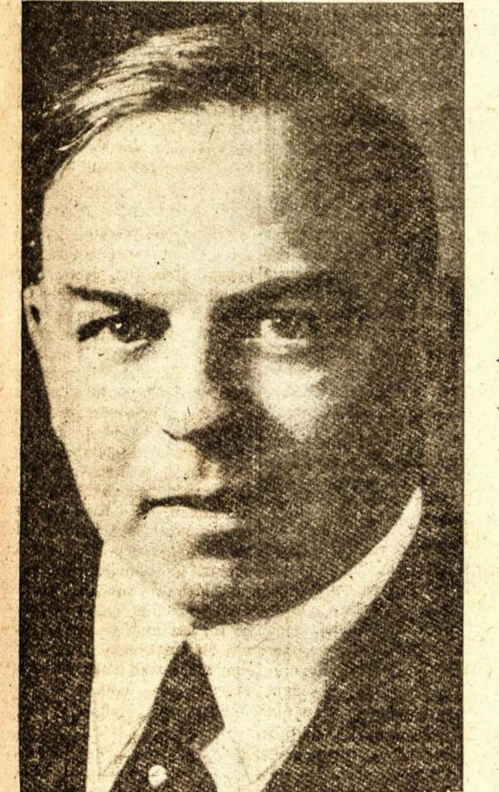
Minister's Piramininkas W. L. Mackenzie King