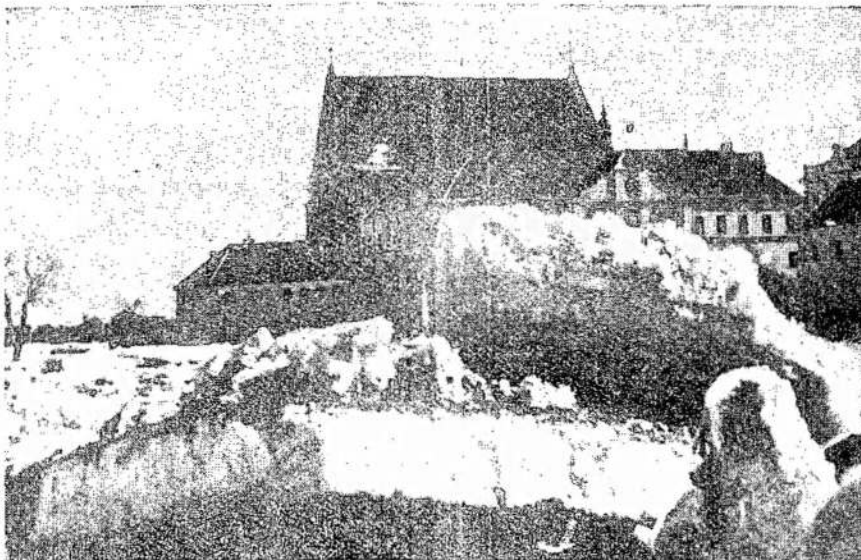
1940 METŲ PAVASARIO POTVYNIŲ KAUNE VAIZDAI. Nenuimti jau pradėjus eiti, staiga naktį į balandžio 4 d. Išdoma susikimimas, įvyko lūptas, bet nepaprastai markūs potvyniai, porai valandų uždėjęs Kauną senamiestio, Vilijampalės, Marvilės, Raudondvario ir Zapyškio dalis. Vaizduose matomi to potvynio pėdsakai Kaune kokie buvo rasti balandžio 4 d. rytą: Potvyniai atsūgus, paliktos didžiulės ledinės Kauno kamijų seminarijos kieme.

Kaunas. — Švietimo ministerijos pradžios mokslo departamento direktorius išvyko į Rygą, susipažinti su Latvijos lietuvių mokyklų būkle ir susitarti su Latvijos švietimo įstaugomis dėl tolimesnio lietuvių pradžios mokyklų tvarkymo Latvijoje ir lietuvių mokyklų Lietuvoje. Pagal oficialią latvių statistiką Latvijoje pradžios mokyklų lanko apie 1.500 lietuvių moks-