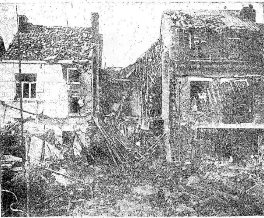
REZULTATAS VOKIEČIŲ BLITZKRIEGO BELGIJOJ. Taip tai vokiečiai kovoja "prieš neteisybę." Tokių valdų Belgijoje, Olandijoje ir kituose nazių nuteriuose miestuose labai daug. Tai jau antru kartą šiame šimtmetyje. Pirmą kartą tas įvyko 1914-18 metais.

Visų priešakys stovi nikelio kompanija su $7,292,012 ir mėn.