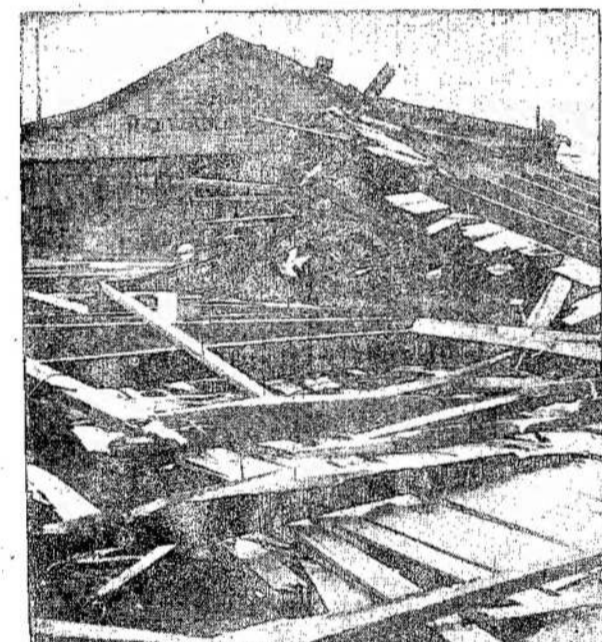
PEREITĄ SEKMADIENI ŠIAUTUSIOS AUDROS DARBAS. Tai Don Rowing klubas audros apdraskytas. Nuostolių klubui audra pridarė už $30,000. Visoaudros paliestoji Ontarijos daly nuostoliai labai dideli.

LLD 21 kuopa, Windsor, Ont., per dg. P. P. gautā į organizacinį fondā $16.45. Draugai ir draugės windsoriciečiai gerāi parėmė organizacinį fondā ir, galimas dailtas, kad dar parėms su daugiau.