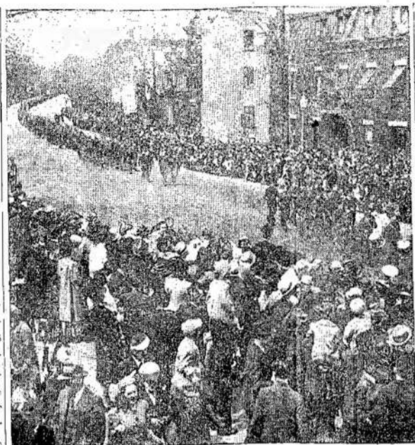
PEREITĄ SEKMADIENĮ MONTREALE buvo didelė kariuomenės demonstracija, kurios pasizūrėti gūtvėse susirinko didelės minios žmonių. Senesnįjį prisiminė tokią demonstraciją 1914 metais, laike pirmo pasaulinio karo.

KANADOS LIETUVIU LAIKRASTIS, LEIDZIAMAS SPAUDOS... Proneeratas Klaime: Kanados ir Didžiojo Britanijos metams $3.00; pusmet metų $1.50. Vismur kitur metams $3.50; pusmet metų $1.75. Atskira kopija 5 centai.