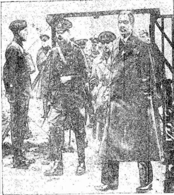
GLEUCESTERIO KUNIGAIKSTIS (vidury), ant kurio viesuočiu Francojji vokiečių orlaivai užmetė dvi bombas. Jo laimė, kad jis tuo metu buvo pasislėpęs sklepe.

Toki panikos kėlėjai ir Kanados silpnųjų vietų išdėvėjai atlieka grynai penktos kolonos darbą. Bet cenzoriai jų nemato. Jie susirūpinę užlaupytų burnos kitų ištikinimų žmonėms.