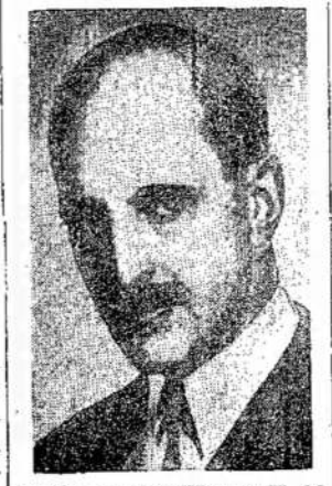
Kapitonas ARCHIBOLD H. M. RAMSAY, Anglijos parlamento narys, kurs kelios dienos atgal suimtas ir įmestas į kalėjimą kaip "dešiniųjų klubo" prezidentas ir vienas iš penktos kolumnos.

Reuters žinių agentūra iš Paryžiaus praneša, kad 60-70,000 sužeista vokiečių iš Flandrijos fronto atgabenta Austrijon.