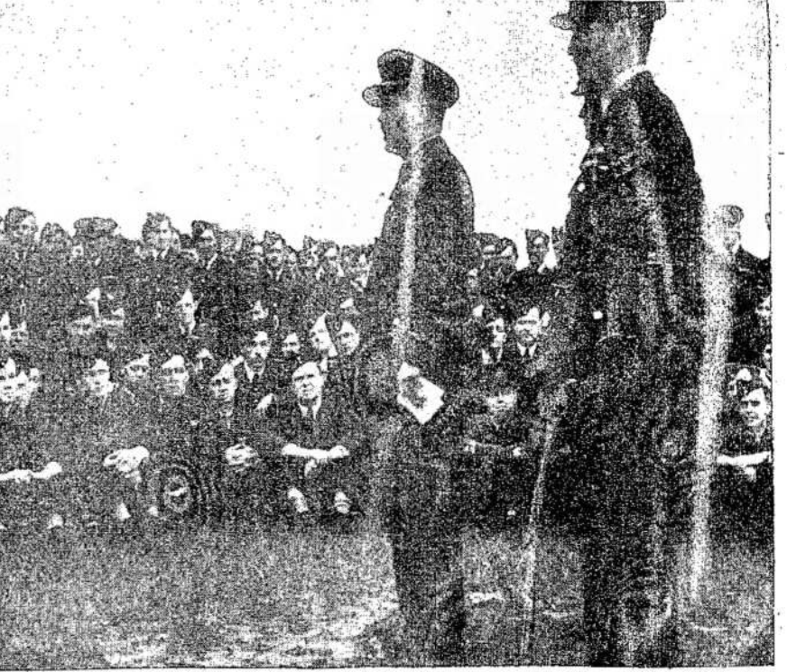
KANADOS ORO JEGŲ VIRŠININKAS Air Marshal William Avery Bishop kalba į lakūnus. Iš kurių 27 užbaigė lavinimosi kursą ir tapo lakūnais. "Mes visi traujamiame tam pašiam tikslui," pareiškė kalbėdamas į lakūnus. Kaip kartais gyvenime pasitaiko Amerikoniškam žurnale "Life" kiek laiko atgal tilpo paveikslas, parodąs Bishopą su Goeringu. Atrodo tuomet Goeringas ir Bishop buvo gerus santykiuos.