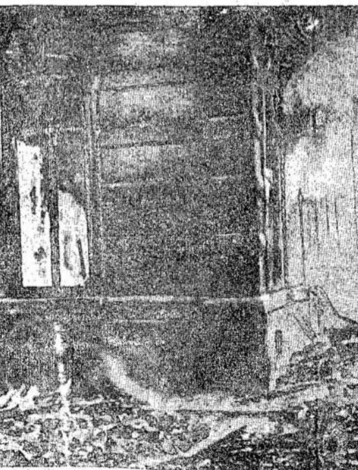
VIENAS IS BELGIJOS MIESTO NAMUR namų ugnye, padegtas nazių bombų. Kadaigi Namur kiek ilgiau laikėsi, tai buvo labai apatūtytas.