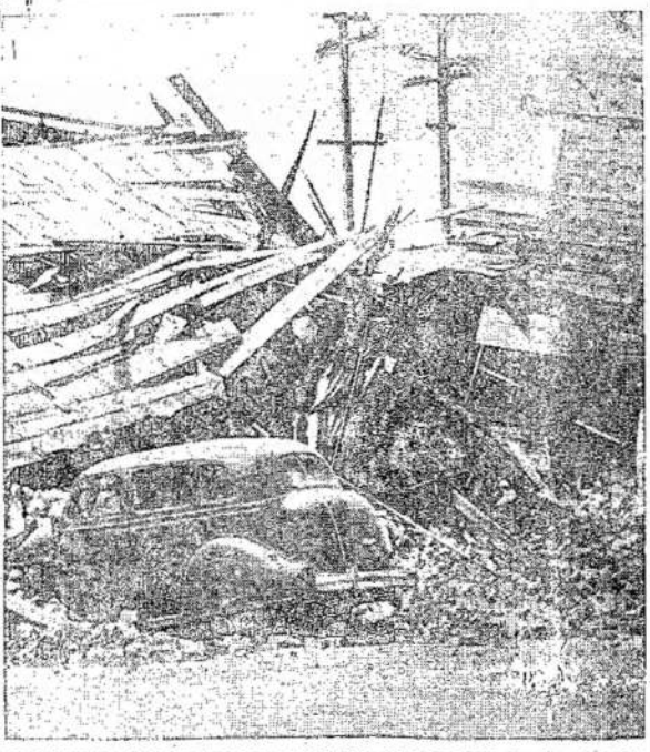
NESENAT KALIFORNIOJ ĮVYKO SMARKUS žemės drebėjimas. Štai Imperial mieste, Imperial slėny, spgriauto namo lentgaliai ir plytos kuone sutrynė automobilio, stovėjusio prie namo. Šioj apylinkėj žuvo aštuoni asmenys.

Kadangi atakų planai visuomet būna laikomi paslaptimi, todėl šio žurnalo išleisti planai gali būti tik spėjolimai. VOKIEČIAI SUNAIKING AMERIKIEČIŲ LIGONINĖ KUR NORS Francijoje, Geg. 27. — Vokiečiai bombardavo amerikiečių ligoninę Ostende. Zuvo visi gydytojai, slaugės, apie 200 ligonių ir tam tikrais skaičiais pabėgėlių.