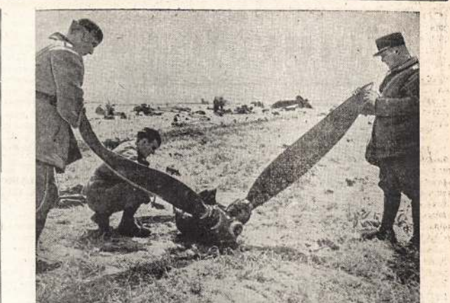
FRANCOZAI EGZAMINUOJA VOKIECIŲ bomberio propelerį. Oriaisvis išlankstė į visas puses, kuomet įvyko eksplozija jam n ukritus ir atsimušo į žemę.

Mes tikimės, kad šis Jaunimo choro atsilankymas Toronte ne tik suartino, j artimesnius santykius surišo tu dviejų didžiųjų lietuvių kolonijų menininkus, bet taipgi suartino j glaudesnį bendrabūvimą kaip pašalpinę, taip ir apsvietos draugijas. Mes aiškiai suprantame, kad Jaunimo choro žygis nebūtų į