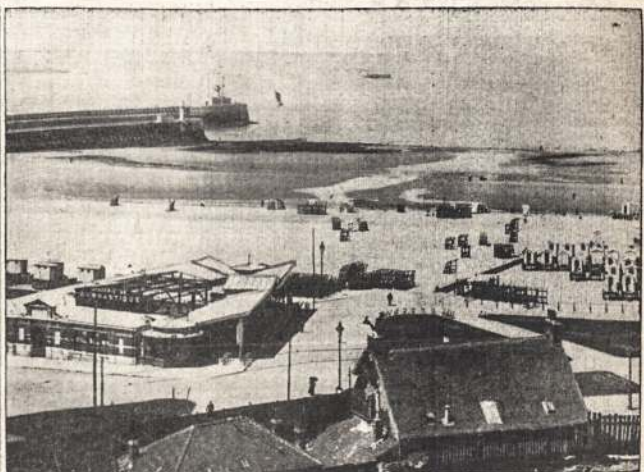
FRANCIJOS UOSTAS BOULOGNE, kurs nuo Anglijos visi arti. Vokiečiams šita uostą užėmus, taigpi ir kitus pakraštinius miestus, santarvininkams pasidaro sunku ne tik amunicijos gauti, o ir pasitraukti iš apsupimo.

Kaip tik tą naktį vokiečiai pradėjo savo ofensyvą Sedano srityje ir įsiveržė Francijon ties Meuse, kur tas generolas turėjo dežiuoti.