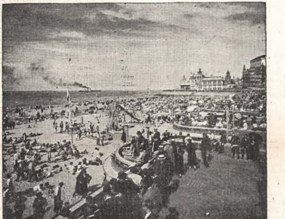
GRAŽUS BELGIJOS UOSTAS IR KURORTAS OSTEND, kuris daug nukentėjo nuo vokiečių bombų laike mūšių. Belgijos karaluti įsakius kariuomenai pasiduoti, mūšiai aptilo ir vokiečiai pasileido link Ostendo ir kitų Belgijos miestų ir uostų.

Dusulys yra paimi liga, visokio pažėjimo. Kai kuriais dusulio nuotikiais ligoniui lengviau pasidaro, kai jam gydytojas su adatu įleidžia virškinamųjų liaukų sunkos. Palengvėjimas tesiaisi ilgiau, jei tos liaukos hormonai esti išstarpinti aliejū.