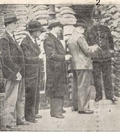
ANGLIJOJ DIDELIS SUSIROPINIMAS del pavojaus iš Vokietijos parašiniūnikų. Valdžia organizuoja tam tikrą apsaugą iš civilių gyventojų. Paveiksle matote keletą piliečių, atvykiusių užsiregistruoti į antiparašiniūnikų organizaciją, kuri turinti jau pusę milijono narių.

Atrodo, kad karas yra nukreipys visą atyją į save, todėl yra pamirštama labai svarbius darbai. Reikių apie juos atsiminti.