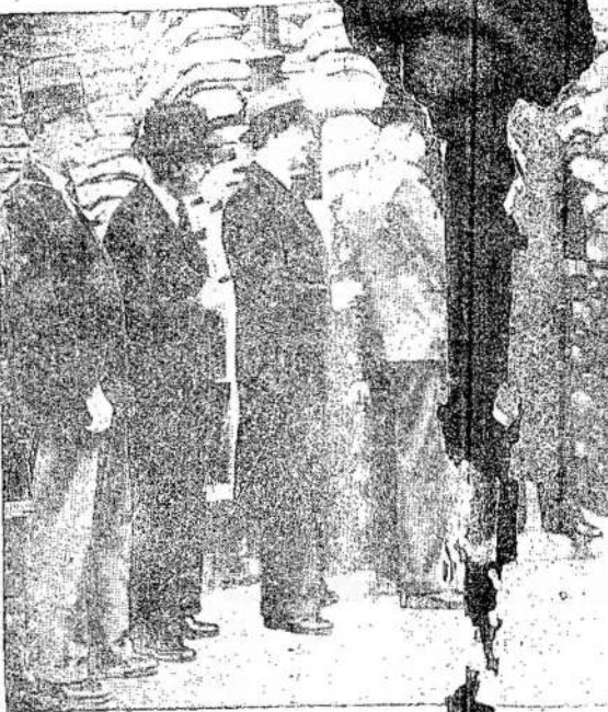
ANGLIJOJ DIDELIS SUSIRŪPINIMAS dėl pavojaus iš Vokietijos parašūtininkų. Valdžia organizuoja tam tikrą apsaugą iš civilių gyventojų. Paveiksle matote keletą piliečių, atvykusių užregistruoti į antiparašūtininkų organizaciją, kuri turinti jau pusę milijono narių.

Atrodo, kad karas yra nukreipęs visų atydą į save, todėl yra pamirštame labai svarbius darbus. Reikėtų apie juos atsiminti.