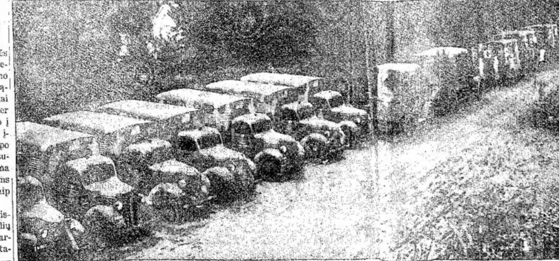
AMBULANSAI AMERIKIECIŲ Raudonojo Kryžiaus ligoninės O stende, Belgijoje, išsako vokiečių orlaiviai sunaikino, užrašdami ligoninės personalą iš 200 asmenų. Už medžių matosi ligoninės pastatai, kuriuose sugriauti visi.