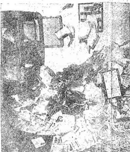
ŠIAIŠIŠKŲ NAMŲDŲ POLICIJA šiuo metu su Montreale policija kiek laiko atgal iškrėtė 13 vietų Montreale ir rado 6 sunkiai sužeidusius žmones, iš kurių trys mirė, atvykęs bei plaktas. Bet iki šio laiko nebuvo girdėti, kad bent vienas iš jų būtų būtų mirtis. Kadangi, jei ne mirė, ar netgi mirė. Tur būt sąrašas surado labai daug pažeistųjų.