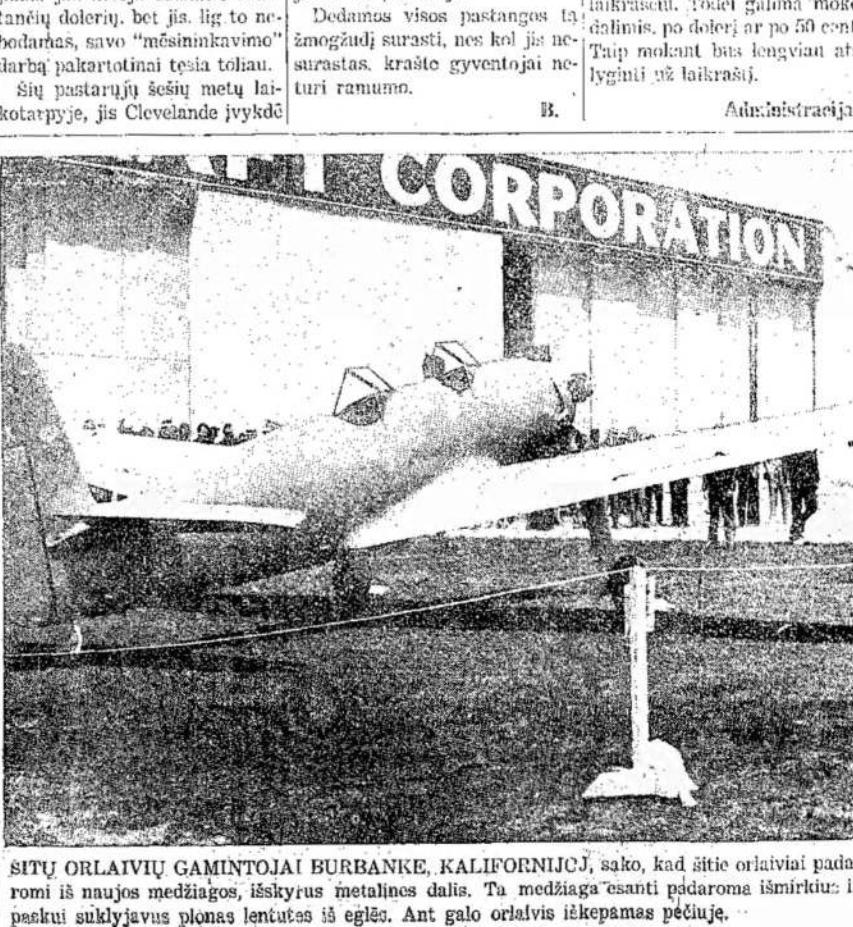
SITU ORLAIUVI GAMINTOJAI BURBANKE, KALIFORNIJČJ, sako, kad štie orlaviiai padaromi iš naujos medžiagos, išskyrus metalines dalis. Ta medžiaga esanti padaroma išmirkus ir paskui sulkyjvus pilnas lentutas iš eglės. Ant galo orlaviis iškėpamas pečluje.