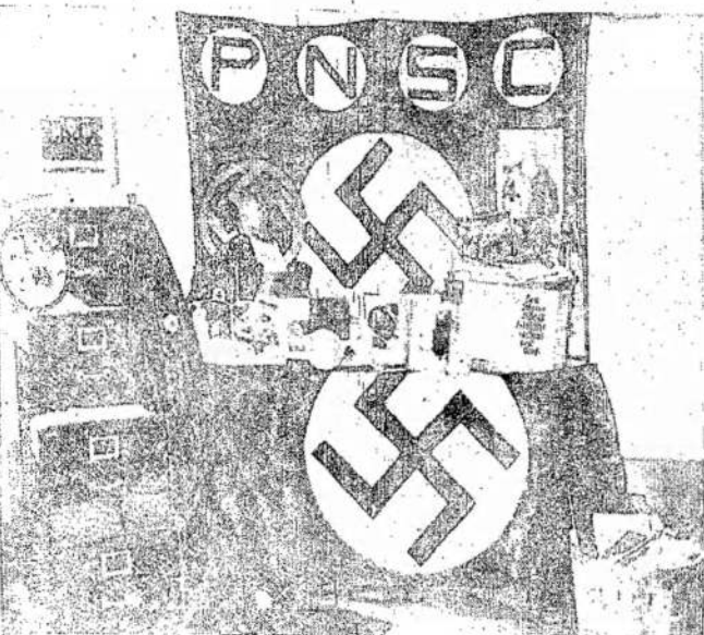
ŠIAIŠIŠKŲ NAMŲDŲ POLICIJA šiuo metu su Montreale policija kiek laiko atgal iškrėtė 13 vietų Montreale ir rado 6 sunkiai sužeidusius žmones, iš kurių trys mirė, atvykęs bei plaktas. Bet iki šio laiko nebuvo girdėti, kad bent vienas iš jų būtų būtų mirtis. Kadangi, jei ne mirė, ar netgi mirė. Tur būt sąrašas surado labai daug pažeistųjų.