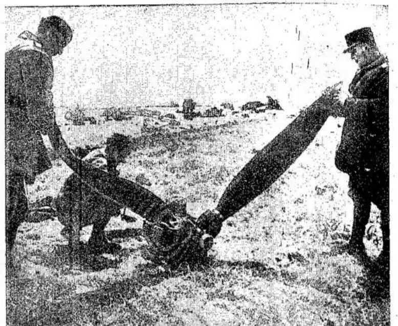
FRANCOZAI EGZAMINUOJA VOKIEČIŲ bomberio propelerį. Orlaivis išlaskė ir visas puses, kuomet įvyko eksplozija jam n ukritus ir atsimusus į žemę.

Mes aiški, surantame, kad Jaunimo choro vygis nebūtų įvykęs, jei to žygio nebūtų rėmusios Montrealo lietuvių draugijos. Už suteiktą Jaunimo chorui paramą, Lietuvių Literatūros Draugijos 162 kuopa reikiama širdingą padėką ir pasižada tokia pat parama paremti Toronto Bangos chorą, kad jis atveityje galėtų tuo patim atsisteisti montrealiečiams.