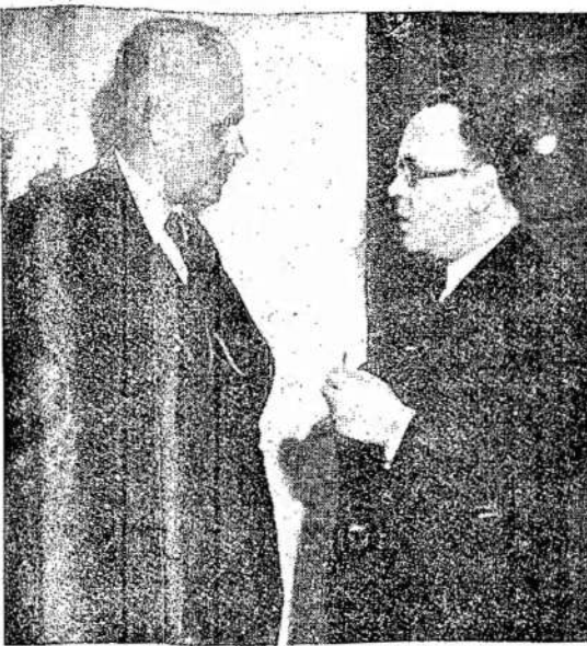
MINISTERIS PIRMININKAS A. MERKYS kalbasi su Sovietų Sąjungos įgaliotu ministru Lietuvai N. Pazdnikovu "Eltos" 20 metų sukakties mišigime 1940 m. kovo 31 d.

1939 metų pabaigoje buvo 6,426 pensininkai: 3,769 civilių