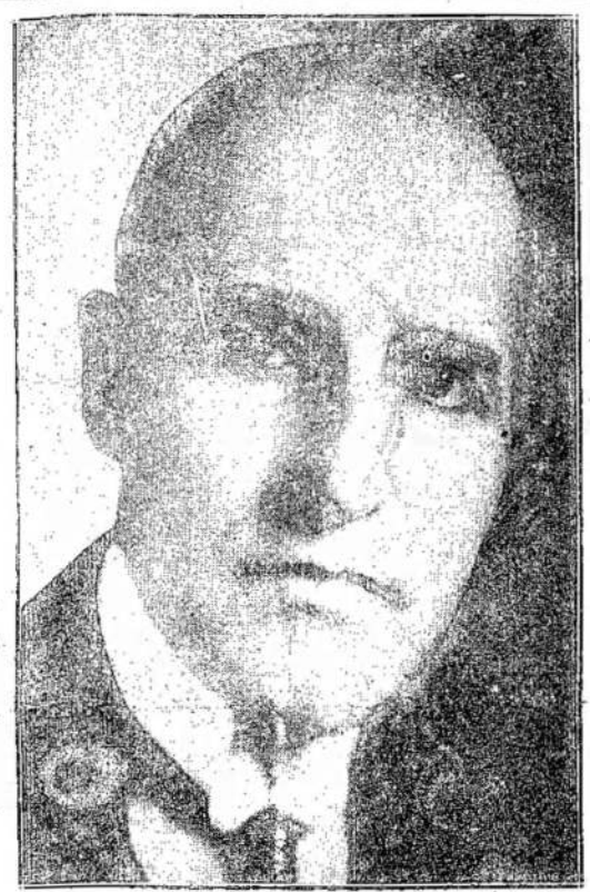
PULKININKAS J. L. Ralston, naujas Kanados apsigynimo ministras.

earijos, greitai šaurina pasitraukimo kelią ir iš užpakalio jiems pastoja. Tuo patiu šydia, po Paryžiaus užėmimo, naziai visu frontu pradėjo naują puolimą ir nesulaukdamai stipraus pasipriešinimo smarkiai varosi pirmyn į visas puses. Francijos armija atsiduria į desperatišką padėtį, kuri susidarė, greičiausiai, dėl išdavikiškos komandos. Mazino tvirtumų linija, kuri jau vokiečiai užėmė, buvo statoma per daugelį metų ir kainavo apie bilijoną dolerių.