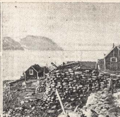
SAKO SOVIETŲ SAJUNGA kolonizuoja (apgyvendina) savo salas Beringo sąsiauryje. Be to, eskimai ant jų salų statė aeroromus. Atvaizde matote eskimų namukus ant Diomedės salos, kuri yra arti Alaskos.

Eidamas pro kryžių madą kalbėjai. Pūles ant kelių ausin anabūdėjai. Snypšdams, kriokdams norėjai vesti. O dabar nori mane pamesti.