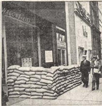
AMERIKOS VALDŽIOS pastangos, kad patraukti daugiau savanorių į armiją, yra smėlio maišai prie rekrutavimo ofiso.

LIETUOVĖS BUS PRADĖTA GAMINTI FILMŲ KRONIKA Kaunas. — Prieš porą mėnesių įsteigta akinė Lietuvos „Filmos“ bendrovė savo darbų prografoje yra numaciūs ga-