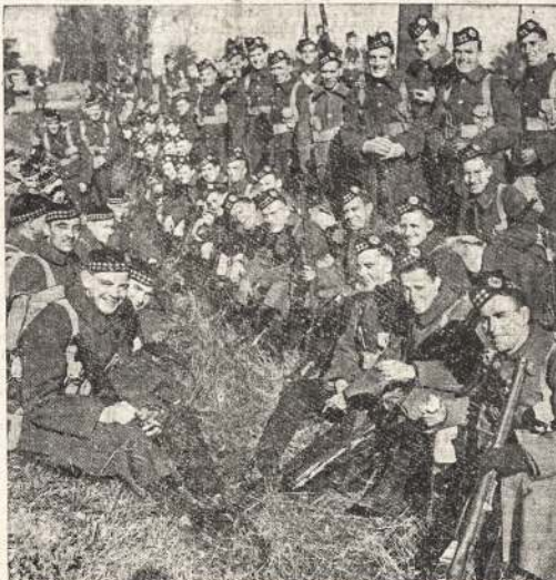
KANADOS KAREIVIAI, kurie buvo nuvažiuavę į Pranciją, kad padėti Francijos armijai atlaikyti nazius. Bet vos jie įvažiavo į Francijos gilumą, juos pasiekė žinia, kad Francijos valdžia kapituliuoja. Nieko nelaukiant teko traukti atgal į Angliją. Francojeji išbuvo tik apie 30 valandų, daugiausia ant traukinio linkui fronto ir atgal, nuolatūs nazijų bomberiams juos persekiojant.