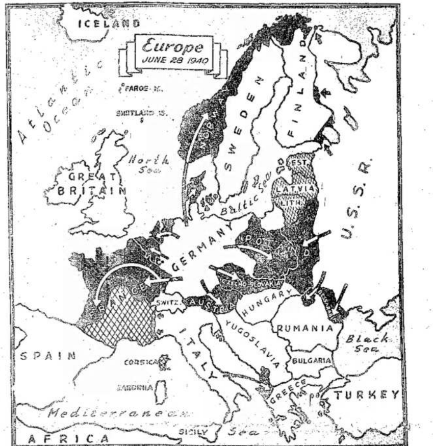
IS ŠIO ŽEMLAPIO galima matyti, kaip dvi didelės jėgos ir idėjos susirėmė Europoj. Vokietijos ir Italijos imperialistai veržiasi į rytus, o Sovietų Sąjunga stengiasi užbėgti jiems už akių ir atremti juos. Vokietiai, susidūrę su Sovietų Sąjunga, metėsi į vakarus. Ar jie dris mėsitis ant Anglijos, niekas negali pasakyti. Italai kito kelio neturi, kaip mėsitis į rytus. Bet Sovietų Sąjunga jau judinasi.

Apskaičiuoja, kad ledai daug jAV labai apdaužė. Nuostoliai siekia šimtus tūkstų dolerių.