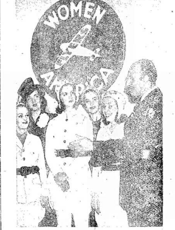
PASIRODO, KAD IR ORLAIVIS kartais gauna "fiat tirc." Nežinrūt to, amerikietės moterys skraidymą orlaiviais labai mėgsta. Apie 400 Šveicarijos Valstijų moterų įstojoj civilinės orlaivininkystės korpusą, kurio dalyvės matomos apačioje. Visuotinis pavėgslas perodo moterų lakiųjų lenktynių dalyvės. Lenktynės įvyko Lock Haven, Pa.