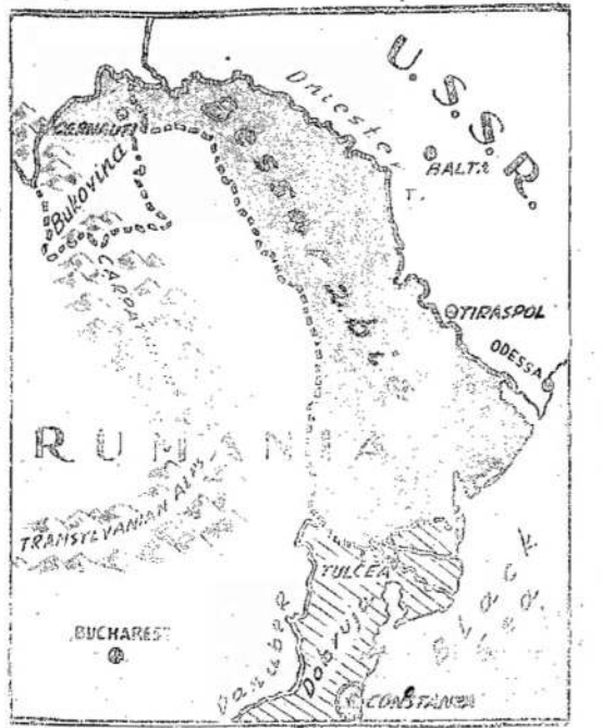
BESARABIJA ir šiaurinė dalis Bukovinos, kurios perėjo Sovietų Sąjungos rankoms.

Neoficialiai pranešama, jog Komunistų Partija Lietuvoje, Latvijoje ir Estijoje reikalauja, kad naujosios tų kraštų valdžios paimitų stambesnę pramonę ir valstybės rinkas, kad pedantų dvarų žemes bežemiams ir mažžemiams, kad įsteigtų žmonių armijas, kurios reikale kariuotės petys petin išvien su Raudonoji Armija.