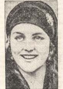
PONIA DIANA MOSLEY, Anglijos fašistų vado žmona, kuri irgi įmesta į kalėjimą. Ji yra sesuo panėlos Unity Freeman, Mitford, kuri draugavo su Hitleriu, bet vėliau buvo atgabenta į Angliją su kulka sprande.