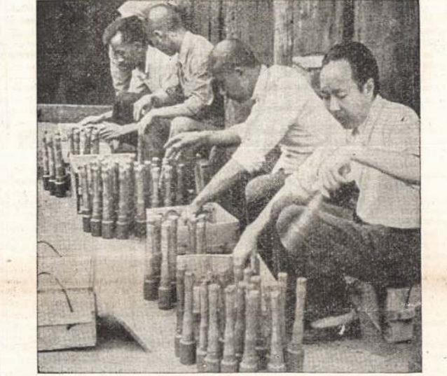
KINIECIAI KOVOJE PRIEŠ JAPONUS naudoja savo darbo granatas. Atvaizde matote grupę kinų, rankinių granatų darbininkų. Kinijos valdžia sako, kad Kinija dabar pasigamina daug ginklų ir amunicijos. Jeigu kitos šalys japonams neparduotų nei ginklų, nei žalios medžiagos, Kinija japonus greitai išvystų.

Šis klausimas visus labai įdomauja. Anglijoje tokio puolimo senai laukia ir jo atmušimui yra visos jėgos paruoštos. Dabar pradėta skieisti pranešimai, kad naziai savo puolimą pradės 9 ar 10 d. liepos mėn. Bet tokie iš anksto datos nurodymai niekada neįsipildė. Italijos laikraščiai plačiai rašo apie tokį puolimą ir nurodo, kad Vokietija tokiam puolimui yra pilnai pasiruošusi ir gali jį pradėti bile valandą ar dieną.