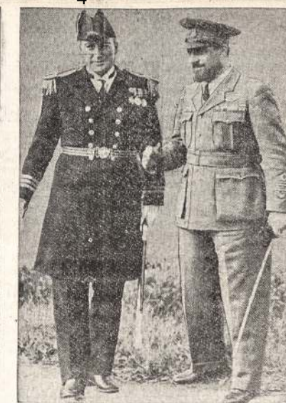
MARSALAS ITALO BALBO, KURS NESENAI ŽUVO. Italai aiškina, kad jis su kitais skrido inspekcijos reikalais, kuomet ant jo orlaivio užpuolė Anglijos orlaiviai ir numušė jį su visais keleiviais. Anglijos vadovybė sako, kad Anglijos orlaiviai tuo vietoje nebuvo. Nekuriuose rateluose kaiba, kad Balbo buvo aukta, nes Musolinis pradėjęs jo neapkęti del jo populiarumo.