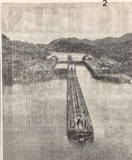
SUVIENYTŲ VALSTIJŲ VALDŽIA UZMINAVO abudu Panamos kanalo galus. Atrodo, kad Suvienyotos Valstijos laukia užpuolimo. Tačiau neatrodo, kad bent viena šalis galėtų dabar tą padaryti. Pavojus galėtų būtį iš Japonijos, bet tuomet kyla klausimas, kodėl Suvienyotos Valstijos nesulaukia Japonijai kariskos medžiagos?

Francija duoda didelę pamoką. Ji puikiausiai parodo, kur giū el pavojus. Šios šalies ir kitų demokratinųjų šalių žmonėms tenka būtį atsargiais. Tie ponai, kurie praitytė dirbo ranka rankon su Daladėje, su Cemberlenu ir garbino Gamelinus bei Weygandus, nėra jokia garantija. Jų šauksmai prieš nazius, prieš ateivius yra tik priedanga.