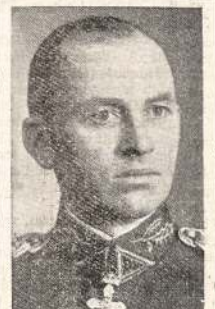
Brig. gen. KAZYS MUSTEIKIS, kuris kartu su Smetona pabėgę užsienį. Prie Smetonos režimo jis buvo krašto apsaugos ministru.