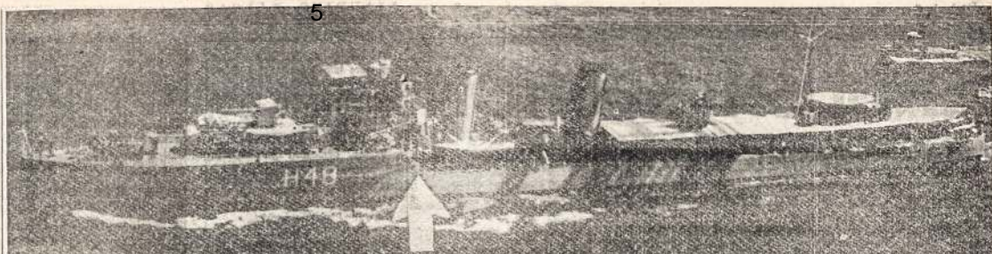
KANADOS KARO LAIVAS F RASER, kurs nuskendo Francijos pakraščioje, kuomet susimūšė su kitu laivu. Kartu su laivu žuvo 45 jūrininkai.

B. TOKIO. — Anglija atmetė Japonijos reikalavimą uždarinti susisiektis tarp Burmos ir Cinkijos, dabartines Kinijos sostinės.