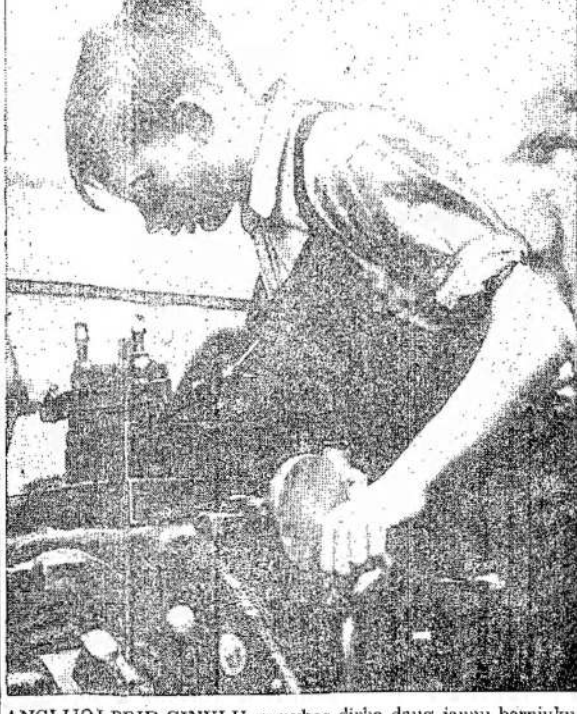
ANGLIJOJ PRIE GINKLŲ gamybos dirba daug jaunų berniuku, kaip kad šiame paveiksle matomas.

LONDONAS. — Anglijos val- dzia „užsaldė“ sulaukė Lietuvos aukš, stiprius jos užsienius pinigus ir bonus-šėrus, kurie bu- vo laikomi Anglijos bankuose. Taip anglų valdzia pasielgė ir su Latvijos ir Estijos aukso, vertės popieriais ir pinigais, esamais Anglijos bankuose. Kiek pirmiau prezidentas Roo- seveltas „užsaldė“ Lietuvos, Lat- vijos ir Estijos ir jų piliečių pi- nigus, šėrus ir bonus esamus Jungtinių Valstijų bankuose. Tai todėl, kad tos šalys nuspre- dė įstot į Sovietų Sąjungą. Sovietų Sąjunga tada stipriai užprotestavo prieš tokį Roose- velto žingsnį.