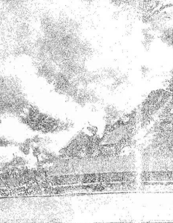
NEGANA, kad saulė kepino, dar ir gulsas prisidėjo. Cikagiečiams, gyvenantiems arti lentų sandėlio, buvo galima ir iškepti, kai tas sandėlis užsidegė. Nuo saulės spindulių karštis buvo 95 laipsnių, o prie to prisidėjo dar ir ugnis.

Fašistai, kaip pasirodė, labai agresyvi. Kada tautininkai smurto keliu nuvertė demokratinį keliu rinktą Lietuvos valdžią, pažangieji jokers valdžios užsienyje neorganizavo. Fašistai už kelių dienų pradėjo kalbėti ir rašyti apie savo vyriausybės steigimą.