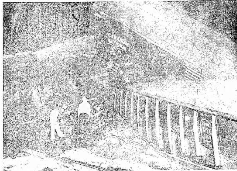
LIEPOS 25 NAKTĮ SUSIKLĖDU CNR prekiniai traukiniai. Nelaimė įvyko Strathroy jarde. Sušvertė į krivą 25 vagonai. Jie degė kelias valandas, kol Strathroy gaisrininkai gaisrą likvidavo. Iš žmonių trys buvo sužeisti. Visi trys traukinio aptarnautojai.

RYGA. — Latvijos seimas liepos 23 d. išleido pareiškimą, jog nuo šios dienos lieka išlaisvinti valstiečiai, kurie "per šimtmečius kentėjo priespaudą nuo išnaudotojų, dvarininkų, baronų ir kitų stambių žemės dvarininkų... Dabar darbininkai, valstiečiai ir profesionalai tapo vieninteliais, tikraisiais Latvijos šeiminkais." Visa Latvijos žemė su gamtiniais jos turtais yra paskelbta kaip žmonių nuosavybė, tai yra, liaudieskos valstybės savastis. Dirbantiems valstiečiams paliekama ūkiai iki 75 akrų žemės. Visa kita žemė virš to tampa pervesta į valstybinį žemės fondą, kuris dalins žemę bežemiams ir mažžemiams valstiečiams. Latvijos seimas pareiškė: "Visa žemė, kurią dabar turi dirbantieji valstiečiai, taip pat žemė, kurią valstybė perduos bežemiams ir mažžemiams valstiečiams, bus užtikrinta jiems vartoti ant visados."