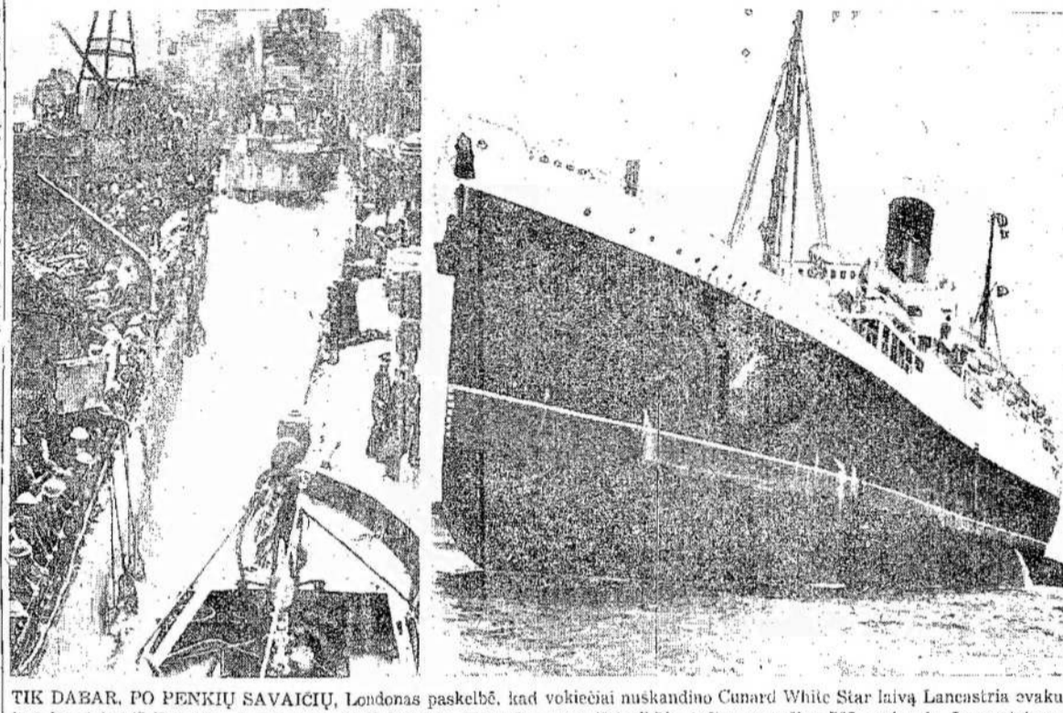
TIK DABAR, PO PENKIŲ SAVAICIŲ, Londonas paskelbė, kad vokiečiai nuskandino Cunard White Star laivą Lancastria evakuojant kareivius iš Frančijos. Laive buvo 6.000 kareivių. Nors dauguma išsigeležė, tačiau nemažiau 500 nuskendo. Lancastria matomas dešinėje. Kairėj — grupė laivų su kareiviais, atgabentais iš Frančijos.

BRITANIJ NAUDOJA FRANCIJOS LAIVUS LONDONAS. — Britanijos valdžia pranešė, kad jau priėmė frantūj valkiamas visa eilė iš frantūj atimty Frančijos karo laivų. Juos aptarnaus anglai ir tie frantūjai, kurie pasilike su anglais. JAPONŲ KAMPANJA KINIJ SMUNKA HONG KONG. — Kinų opozicija pietnėj Kinijoj japonų kampanijai visai suitaikė. Kinai skelbia, kad visos japonų atakos palei Frančiją Indu-Kiniją buvo atrentos su dideliais nuostoliais priešai. Japonais sunku išlaikyti japonų sudarytos Kinijos valdžias karišomė. Nekuriot dalyt rodą palinkimą aukiti, o kitos elgiasi kaip banditai. Japonų blokadai kenkia krantinės Kinijos kanoles. NORI ISVARTYTI 30.000 ŽYDŲ BUCHAREST. — Rumunijos valdžia nori išdeportuoti 30000 žydų, kurie esą ginę Besarabijoj ir Bukovinoj. Jie būsių verčiami grįžti į Besarabiją ar Bukoviną.