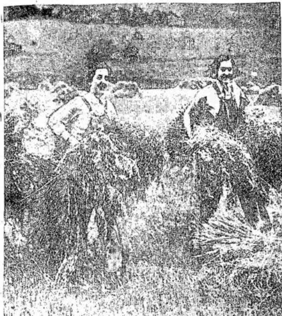
VYRUS SUEMUS Į KARIUOMENĘ, daugelį darbų tenka atlikti moterims. Štai dvi merginos dirba laukuose. Įvairiems kito dar-bams atlikti yra susiorganizavęs taip vadinamas namų frontas.

WASHINGTON, Rugp. 26. — Rytų Suvienijotose Valstijose prasidės registracija visų nepiliečių, kurių sakoma yra apie 3,600,000. Bus nuimtos ir pirštų antspaudos.