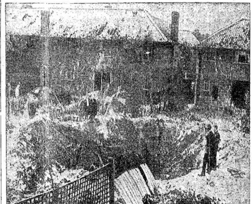
NAZIŲ BOMBOS ISVERSTA duobė prie namų. Nuo trenksmo išbėrė visi langai, o sienos apneštos žemėmis.