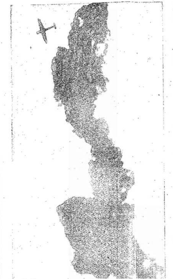
NAZIŲ BOMBERIO pašautas baliūnas pildomas žemyn paliko visą debesį dūmų.

Tie, kurie šiandien dūksta prieš Lietuvos pasisukimą, pučia Smetonos ir saujos jo šalininkų dūdon. Nes tik ta sauja priešinga. Visa Lietuvos liaudis, visa darbo inteligentija, visi laikraščiai stoja su padarytu progresu.