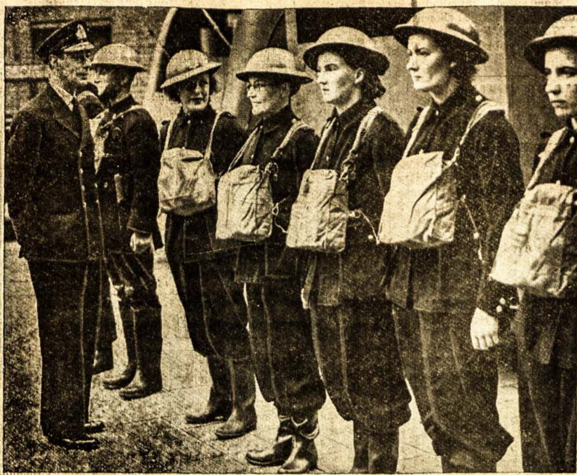
ANGLIJOS KARALIUS APŽIŪRI moteris gaisrininkes, kurios padeda gesinti nazių bombų padegtus namus. Karalius išreiškė joms padėką už didelį pasiaukimą tokiam pavojingam darbiui, kaip kad gesinimas bombų padegtu namu.

Virink mažą "haddock" žuvį iki bus visiškai minkšta. Tada nuimk odą ir išimk kaulus. Sudėk žuvį į gilų išsviestuotą molinį arba pailavotą bliūdą. Išplak 1 kiaušinį su 2 šaukštukais miltų, pridėk puoduką pieno, truputį čibulio ir po žiupsnelį druskos ir pipirų. Gerai sumaišyk viską, tada užpilk ant žuvies, truputį išmaišydama su žuvimi. Uždenk išsviestuotais "krekiu" trupiniais ir kepk nuo 30 iki 40 minučių.