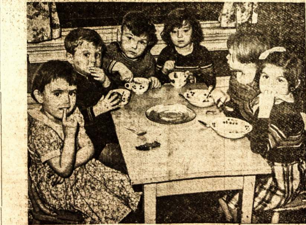
TORONTE, mieste iš arti milijono gyventojų, yra tiktai keturi darželiai, kur vaikus galima paklikti dienos metu, kada tėvai ei na dirbti. Atvaizde matote grupę vaikučių viename iš tokių darželių laike "pusryčių."

— Turėtų būti. Neuzmiršk, kad ji jau keturias kartus buvo susižiedavus.