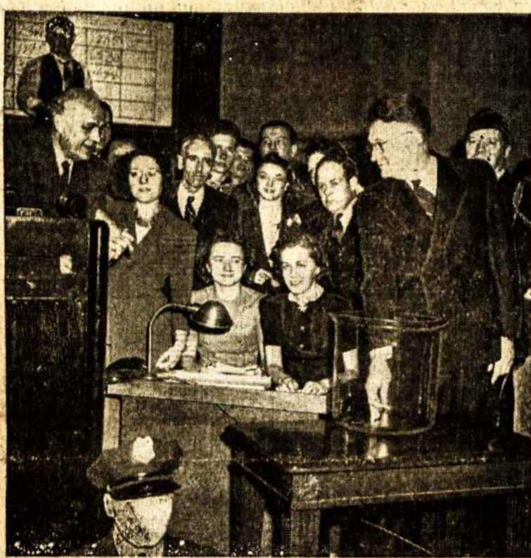
BRIGADOS GENEROLAS Lewis Hershey traukia iš istorinio žuvų butelio paskutinį liosą, pagal ką bus nustatyta, kurie amerikiečiai turės pirmi stoti į verstinių metų karišką tarnybą. Pirmu kartu bus pašaukta 800,000 vyrų, iš arti 20,000,000. Pirmieji numeriai bus pirmiau ir pašaukti.

Sukaktuves dalyvavo ir naujų sovietinių respublikų atstovai.