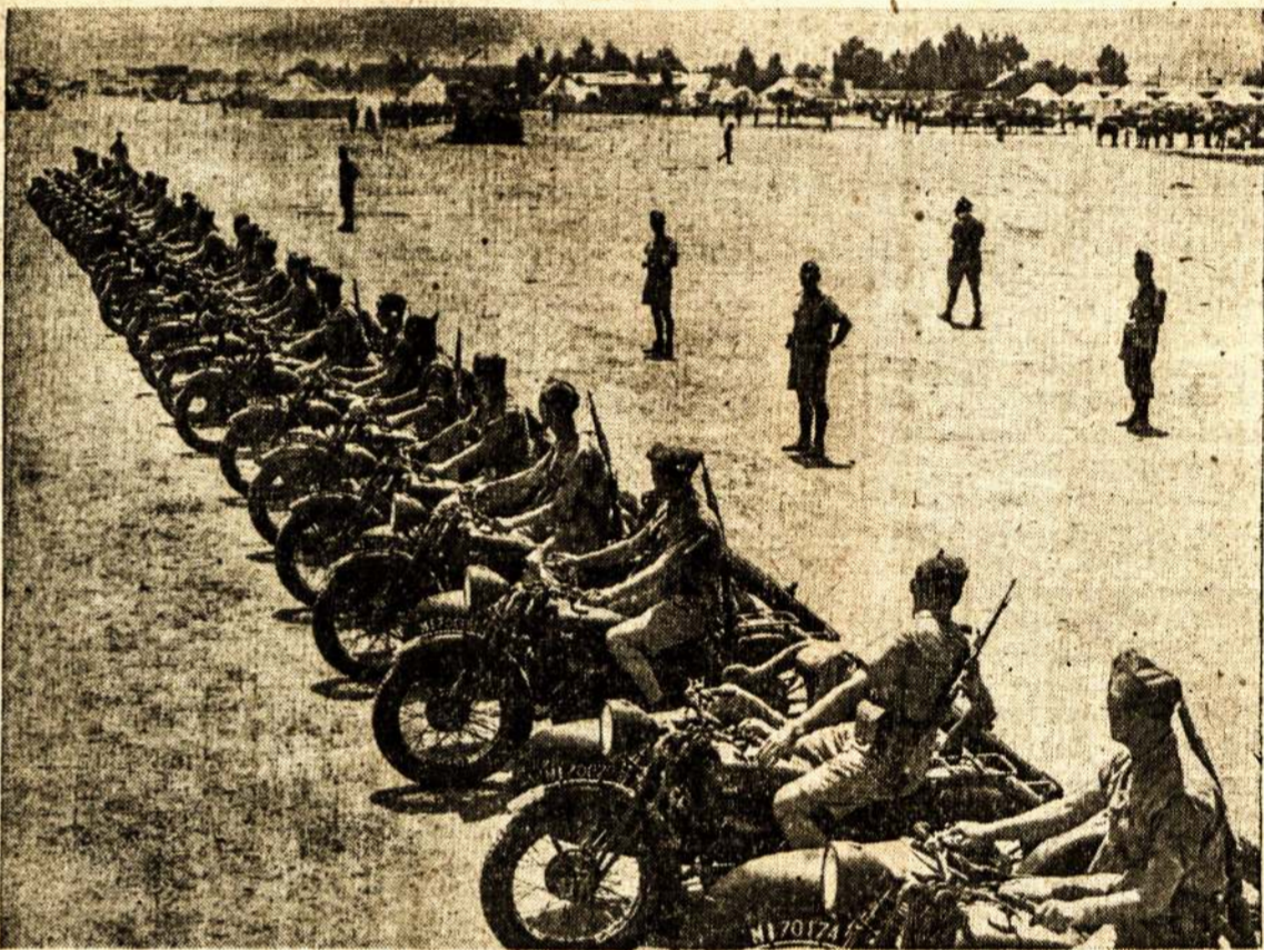
LENKŲ LEGIJONAS, susidedąs iš 6,000 kareivių, stovi Palestinoj. Čia matote to legijono žvalgus su motoreiklais, laike inspekcijas.

Lietuvos žmonės, toliau nurodė jis, buvę patenkinti Raudonosios Armijos okupacija, nes tas išgelbėjo nuo nazių dominacijos. "Nebuvo jokio pasipriešinimo," pareiškė jis. "Aš manau, kad dauguma lietuvių buvo labai patenkinti tuo, kadangi mes bijojome nazių invazijos."