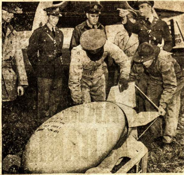
VOKIEČIAI METO ANT LONDONO net iki 1,500 svarų sunkumo bombas. Į ką jos gali būti panašios, galima gauti supratimą pasižiūrėjus į šiame atvaizde matomą 1,100 svarų bombą, rodomą Pietų Amerikos atstovams Langley lauke, Suvienytose Valstyse.

Mes manome, kad visi Liaudies Balso skaitytojai ir remėjai, kovotojai prieš nazizmą ir fašizmą, už laisvę ir progresą tuos dalykus turėsite mintyti ir laiku atėjus tinkamai pasidaruosite, kad laikraštis galėtų tarnauti Kanados lietuviams, kaip ir iki šiolie, gelbėdamas organizaciniame veikime, padėdamas kovoje prieš demokratijos ir liaudies priešus. Kaip vaju darba vesti, manome nereikia jums aiškinti, nes tai jau ne pirmas vaju. Mes tikimės, kad draugai ir draugės dėsite pastangas, kad vaju būtų pasekmingai pravestas.