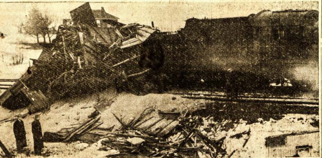
BOWMANVILLE miestelyje ant stoties stovėjo traukinys, kurio užpakalyje buvo prikabinatas vagonėlis del traukinio tarnų. Tuo metu, kai du tarnai tame vagonėlyje trisėsi, visu smarkumu ant jų bėgo kitas traukinys. Bet jie greitai dasiprotėjo, kad reikia šokti lauk. Tik kelioms sekundėms po išsokimo jų vagonėlis buvo paverstas krūva šipuliu.

LLD Kanados Veikiantis Komitetas Angliško Skyriaus Skaitytojų Žiniai Kadangi Liaudies Balso koncertų skelbimai užima daug vietos, o prie to pasitaikė daug kitų greito patalpavimo reikalaujančių raštų, mes buvome priversti Anglišką Skyrių atidėti kitai savaitėi.