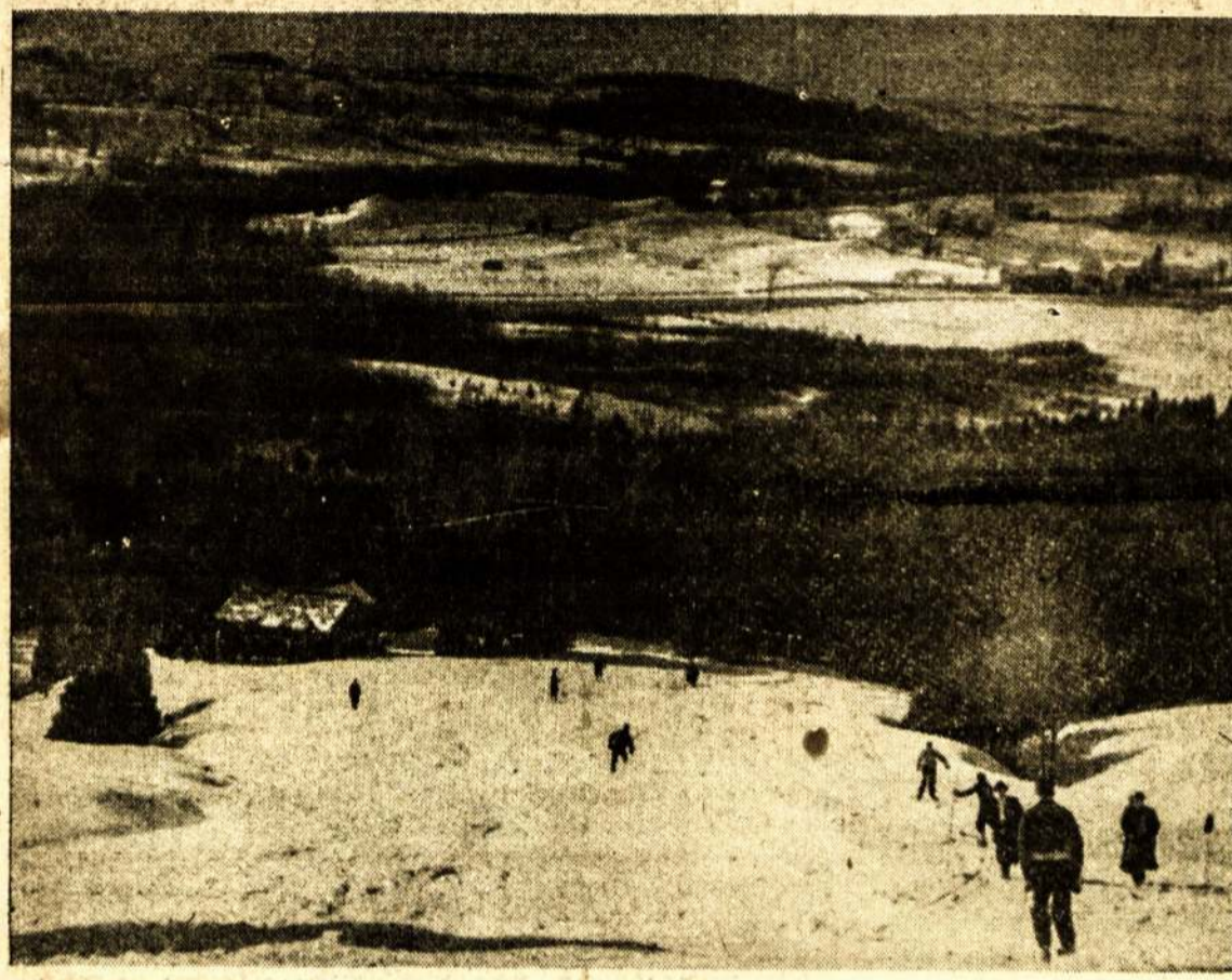
LIKE THE HILLS OF HOME THE ROLLING, snow-clad terrain is beckoning to skiers. Harkening to the voice siren winter, thousands of sports throughout the province of Ontario are spending their week-ends at popular skiing centre. The hills of Bethany, near Peterboro, are often described as a skier's paradise. But not many sons and daughters of working people can enjoy that paradise. This picture was taken atop the ski tow.