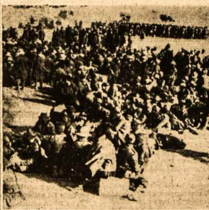
ITALIJOS KAREIVIAI anglų belaisviai Libijoje. Jie laukia, kada juos nugalėns į Egiptą, į belaisvių kempes. Sako anglų jėgos suėmė apie 80,000 Italijos kareivių.