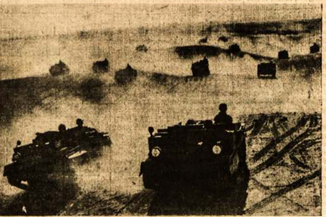
AUSTRALŲ VALDOMI lengvi. Bren kulkosvaidžiais apkingtuotianglų tankai pleška Egipto dykumomis. Tos pačios jėgos puola italus Libijoje. Tai moderniškai „kupraunagariai.“

Apsigynimo programa kapitalistams davė gerą ginklą kovoje prieš darbininkus. Jei tik kas reikalauja algų, tuojau tą apšaukia sabotažinku. Jiems padeikia William Green. Tuo tarpu, iš priešasties didelių užsakyimų, fabrikantų pelnai auga ir auga.