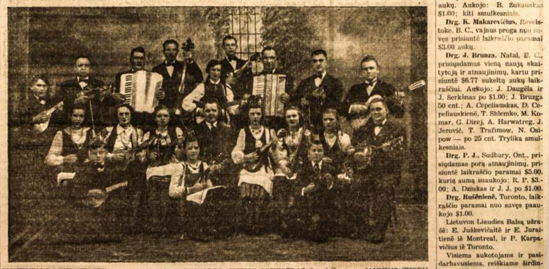
MONTREALO LIETUVIŲ SŪNŲ IR DUKTERŲ PASALPINES DRAUGIJOS ORKESTRAS, ku ris kartu su JAUNIMO CHORU rengia koncertą šio mėnesio 19 dieną, čekoslovakų salėj, 415 St. Catherine St. East. Plačiau apie tai rasite pranešimų skyriuje.