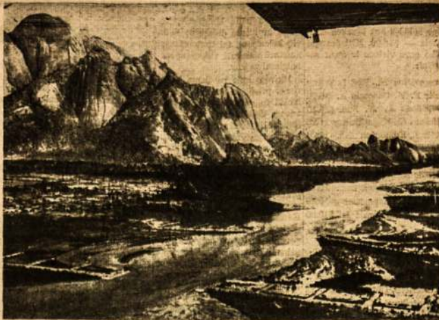
ANGLŲ KARIUOMENĖ spaudžia italus ne tik Libijoje. Kita jų armija pradėjo stumti italus link Raudonųjų jūrų per Eritreją. Anglai pasitarė pirmyn apie 70 mylių į Eritreją. Atvaizde matote Kassala miestą Egipto Sudane, kurį italai buvo paėmę iš anglių.