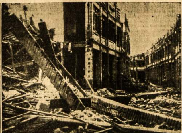
TUO METU, kai vokiečiai griatuna Anglijos miestus, tai japonai Kinijos. Štai scena viename Kinijos mieste Kwangsi provincijoj, kurį dažnai bombarduoja Japonijos bomberiai.

CLEVELAND. — Plieno žurnalas apkačiuoja, kad 1940 metais buvo pasiūsta į jųrų dugną 5,000,000 tonų plieno. Tačiau kiekį sudarą įvairūs nesklendinti laivai, minos, submarinų tinklai, torpedos, orlaivai ir kiti dalykai, nuskandinti į dugną.