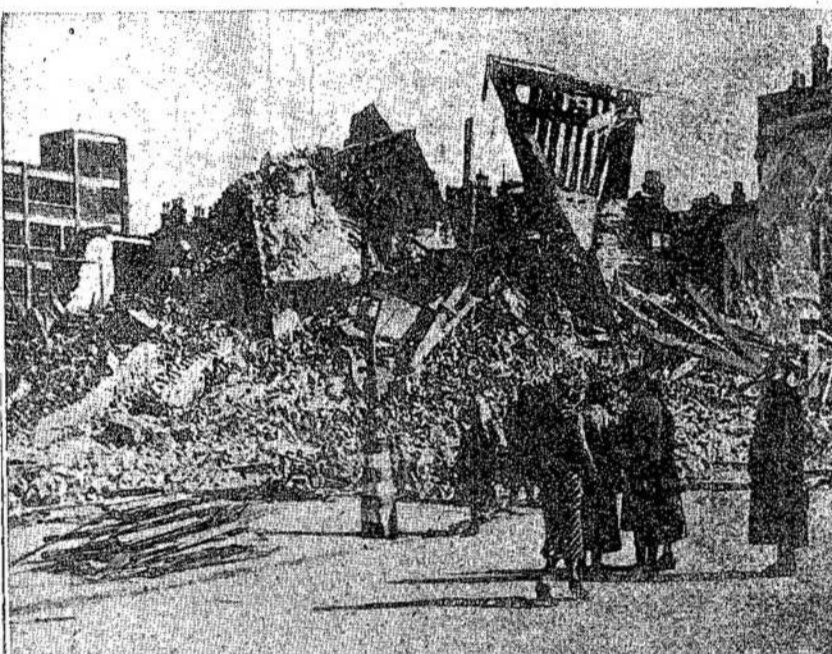
Tai garsiosios Londono Chelsea Old Church liekanos. Šioj bažnyčioj įvykdavo aukštųjų sluogūnių vestuvės. Nazių bombos sulgino ją su žeme. Jos nepaiso nei bažnyčių, nei ligoninių.