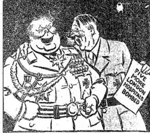
Whitelaw, London Daily Herald.

Ar Nebūtų Gerai Sugrįžti Dar Bent Keletą Bažnyčių, Hermi?