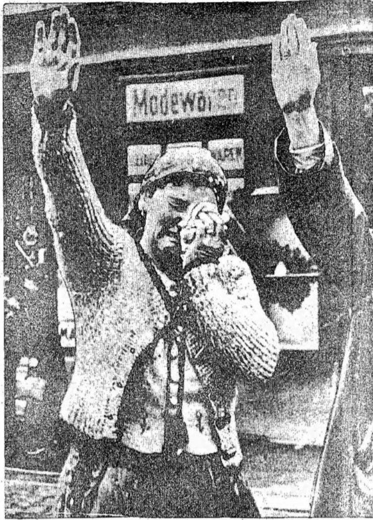
Cekoslovakė moteris sveikina svastiką su asaronis akyse. Panašiai turėtų sveikinti svastiką ir lietuviai, jei Smetonai būtų pavykę atiduoti Lietuvą Vokietijos naziams, prie ko jie rengėsi.

Jeigu Liaudies Balsu neskaitytai kas pasaulyje dedasi nežinai.