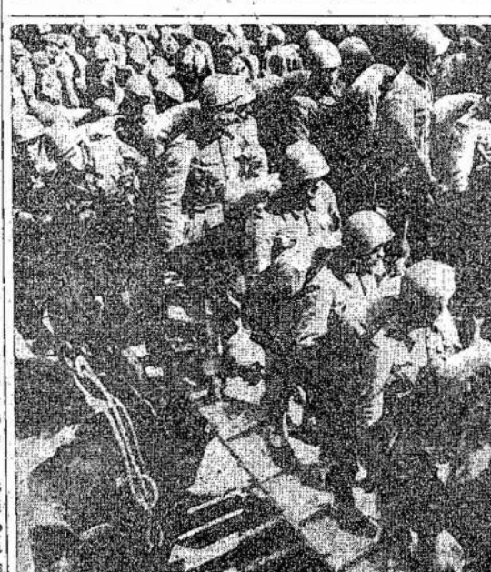
Portugalai traukia į laivą, kuriuo mi jie vyks į Portugalijos salą s Atlanto vandenynė vardu Azores, kad sustiprinti jų įgulą. Ir Portugalija prisibijo, kad naziai neužimty strateginių salų.

Kiek Atsieidavo Rusijai Caras ir Visi Jo Gimines Caro giminė tuomet buvo iš 69 asmenų: tai vis didesni ir mažesni kunigaikščiai, jų pačios ir vaikai. Reikia žinoti, kad caro ir jo giminų dvaruose nuolat buvo keliami neapsakomai brangūs baldai. Savo išlaidumu gėlėjo jiems prilygti nebent tik senoviškos Azijos barbariškų valdovų orgijos. Caras ir jo giminės užlaikydavo, be kitko, puikiausius sau pasivažinėjimo laivus ir nesuskaitomas tarnų armijas. Toks lėbavimas ir plaukiojimas bei važinėjimas po pasaulį surydydavo neapskaitomas sumas pinigų. Tuos pinigus jie sėmdavo iš valstybės išdo, iš karališkų tėvonių (Katrės Antrosios ir caro Povilo palikimų) ir karališkų dvarų nuosavybių. Rusijos valstybė kasmet išmokėdavo 15 milijonų rublių (virš pusąšimto