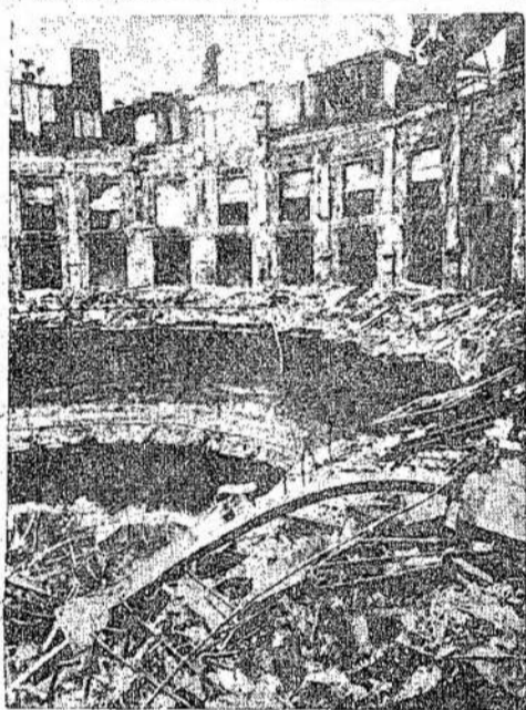
QUEENS HALL Londone, kurią nazių bombos pavertė griuvėsiais. Iš šios halės buvo transliuojamos muzikališkos programos po visą pasaulį.

Beiruto radio skelbia, kad Anglijos jėgos rengiasi užpulti ant Sirijos, ir kad Francijos jėgos Sirijoje ginsis iki pastutinio lašo kraujo.