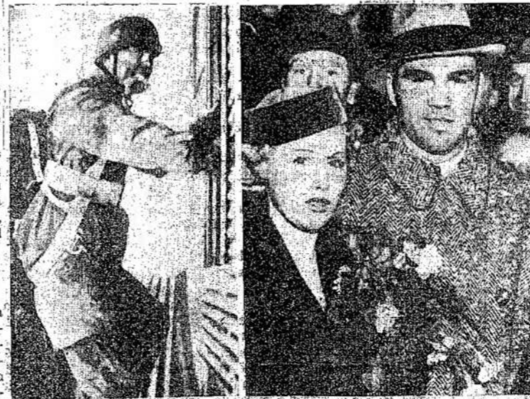
VOKEČIAI PRANESĖ, kad Max Schmelling, savo laiku buvęs sunkiųjų boksinių čempionas, sunkiai sužeistas. Jis būvęs vienas iš parašutininkų, kurie puolė Krotos salą. Dešinėje jis matomas su savo žmona įdžiųjų artistė Anny Ondra. Kairėje — lipas į orląvį taikė lavintinžis. Pasaulinė čempionystė atėmė iš Joe Louis 1938 m.

Be to, ligi šiol buvo didelis nesuderinimas tarp audimo ir verpimo stakių. Prie kapitalistinės santvarkos beveik visos audyklos gaudavo suverptus siūlus ir čia tik išausdavo. Ši aplinkybė mūsų audyklos trukdė plėsti gamybą.