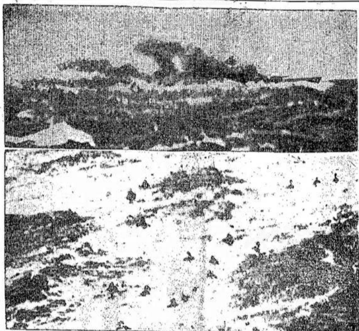
VOKIEČIŲ KARO LAIVO Bismarko paskutinės valandos (viršū) ir jo jūrininkų likimas. Iš 2,300 buvę išgelbėta tik 100, visi kiti nuskendo, kaip ir Anglijos laivo Hood jūrininkai, kuomet Bismarkas nuskandino prie Grenlandijos.

SYDNEY, MINES, N. S. — Princeps mainų 1,100 mainierū vėl išėjo į striuką, jau ketvirtą kartą nuo gegužės 16, kadangi kompanijos ir unijos atstovų konferencija nepadarė jokio progreso.