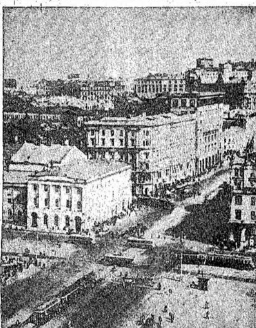
Biznio aikštė Maskvoj. Naziai kas naktį bando bombarduoti Maskvą, bet Maskvos gynėjai nuveja puolikus. Tik vienas kitas bombonis praspunka pro apsigynimo linijas ir apmėto miestą bombomis. Didelių nuostolių nepadaro.

Už vienokią ar kitokią paramą Sovietų Sąjungai kaip solidarumo ženklą pasisako ir daugelio kitų kraštų darbo žmonių organizacijos.