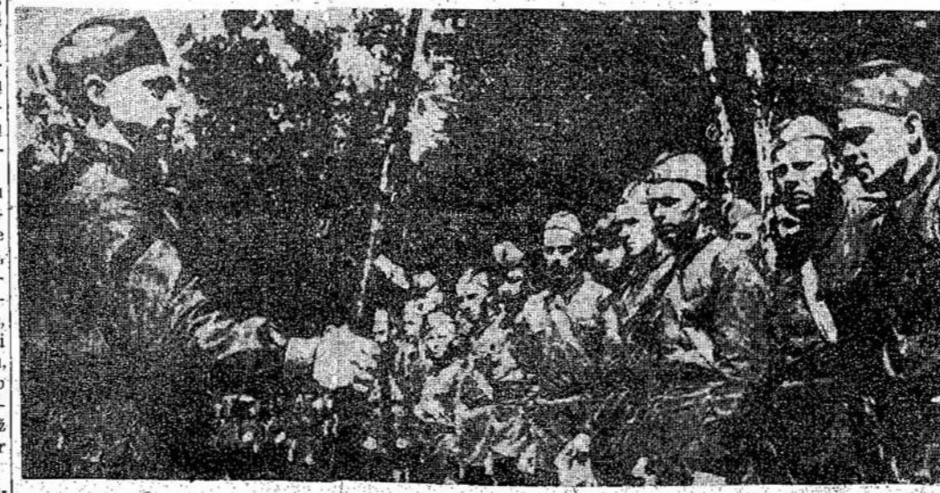
Naziams užpuolus, visi Sovietų Sąjungos vyrai, nuo 17 iki 45 metų amžiaus, stoji į pagelbinę armiją. Ta milijoninė armija jau aplavinta ir pradeda užimti pozicijas užfronty, aleisdama reguliarą armiją kovai pirmose linijose. Atvaizde matote būrį tos žmonių armijos.