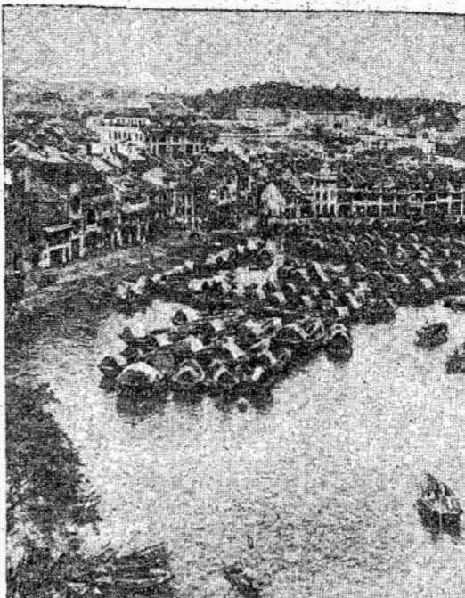
Singapurė, britų laivyno bazė, ir apie Singapūrą labai didelis trafikais mažomis, kaip kad šiame atvaizde matote. Singapūro ir apylinkės gyventojai tokiais valtimis perveža didelį kiekį prekių.

„Olimpiadoje dalyvavo dar daugelis ir kitų mokyklų.“ Apie vaikų olimpiadą šiauliuose Tarybų Lietuva rašo: „Visur pilna tautiniais rūbais pasipuošusių jaunuolių. Gražios, šūkiškas papuoštos valstybinio teatro patalpose olimpiados metu buvo susirinkę per 1,200 dalyvių. Jie atvyko iš 21 valsčiaus. Apie 900 buvo iš 62 pradžios mokyklų ir 300 iš 11 vidurinių mokyklų.“