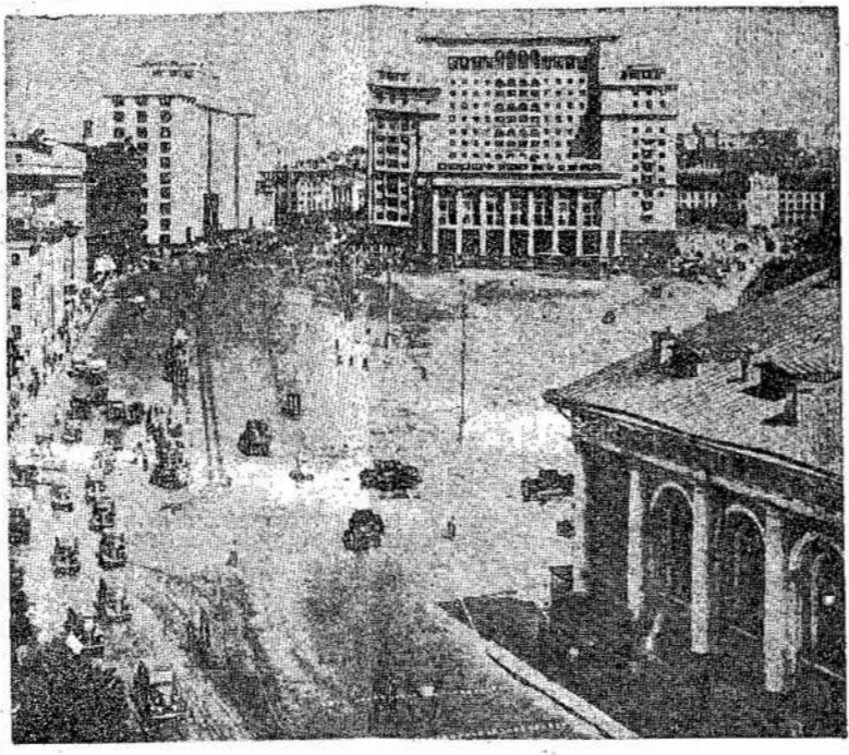
Viena iš puikliausių aikštėjų Maskvoj. Sakoma, kad viena vokiečių bomba sproguos šioj aikštėj. Prie šios aikštės randasi Jungtinių Valstijų ambasados rūmai.

Kaip ilgai sąžiningi liberalai leis žmonėms, kurie sąmoningai ar ne trokšta Hitlerio pergales, nustatyti an-