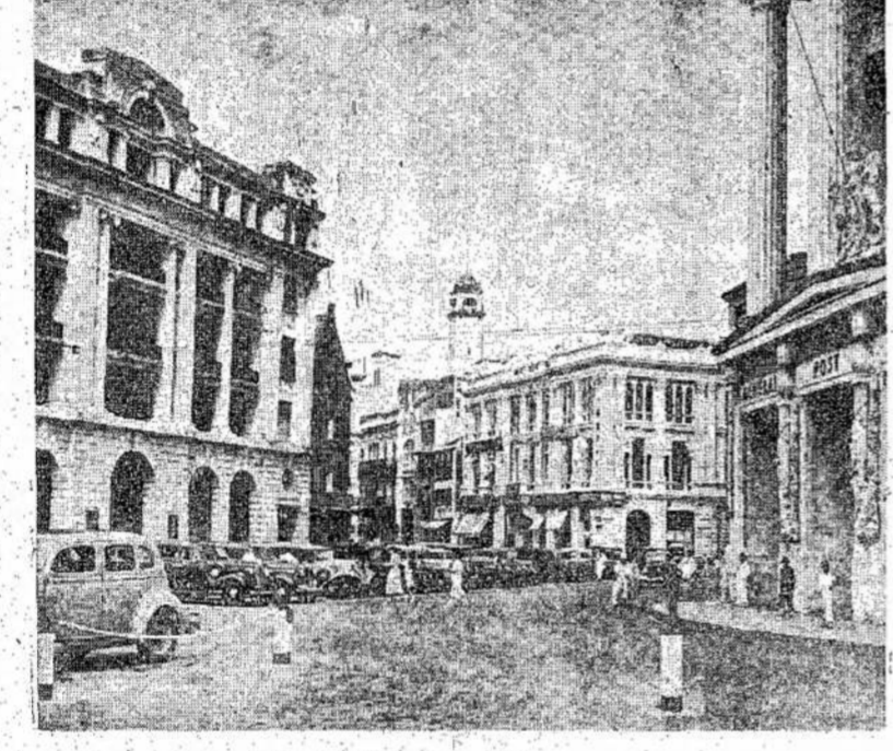
Japonams susikrausčius į F anečių Indo-Kinija, į pavojų atsidūrė britų „Gibraltaras“ rytuose — Singapūras, Britanija ir Jungtinės Valstijos imasi atitinkamų žygių prieš Japoniją. Atvaizde matote britų įstaigas Singapūre.

Jis metus Janssonas tylėjo. Matyt, jis apskritai nebuvo linkęs daug kalbėti, ir tyliedavo ne tik su žmonėmis, bet ir su gyvuliais: tyliedamas girėdavos arkli, tyliedamas jį kinkydavo, iš lėto ir tingėdamas stripinėjo epinkį jį, o kai arklys, tyliėjimu nepatenkintas, pradėdavo neriamai ir strapaiuoti, tad jis tyliedamas mušdavo jį botkaciu. Ipykęs jis mušdavo nesigaliojdamas, o jei tatau būdavo tada, kada jis būdavo neįsispagiriojęs, tad priešdavo ligi žvėriškumo. Tada gyvenamajame name būdavo girdimas bologo pliaukšėjimas ir išgąsdinto arklio trepsėjimas į tvarto medines grindis. Už arklio mušimą šeimininkas mušdavo patį Janssoną, bet negalėdamas jį pataisyti ilgovisi mušęs Janssoną.