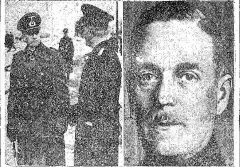
Už tai, kad Hitlerio blitzkriegas prieš Sovietų Sąjungą nevyksta, kaltė matomai su- veržiama ant nekurių armijos vadų. Pranešimai iš Europos kalba, kad Hitleris at- statė vyriausį armijos vadą generolą feldmaršalą Waltherį Brauchitschą ir general- nio štabo viršininką generolą feldmaršalą Wilhelmą Keitelį, Sovietų fronto vadova- vimui pakviets generolą Romelį iš Egipto. Atvaizde matote feldmaršalą v o n Brauchitschą (kairėje) ir feldmaršalą Keitelį (dešinėje), kurie buvo Hitlerio pavartyti nuo komandos.

— Man nereikia skaityti knygu, aš matau tą į tave pasžiūrėjusi, — atsakė jam žmona.