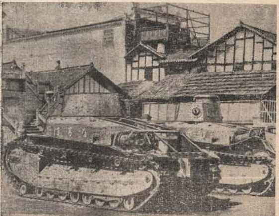
Ne visada ir tankas laimi. Štai japonų tankai kinečių rai kose. Jau penki metai, kai japonai kariuotja prieš Kiniją, tačiau pergalės dar nesimato.

MASKVA. — Generolas leitenantas F. N. Mason-MacFarlane, Britonijos militarinės misijos Sovietų Sąjungoje galva, išvyko iš Maskvos Smolensko ir matė, kaip Sovietų armija tariauja prieš vokiečius. Sugrįžęs į Maskvą jis papasakojo epizodus atstovams, kad Sovietų kariuomenė gerai išvinta ir labai gerai organizuota. Labai puikiai kooperuojantis oro jėgos.