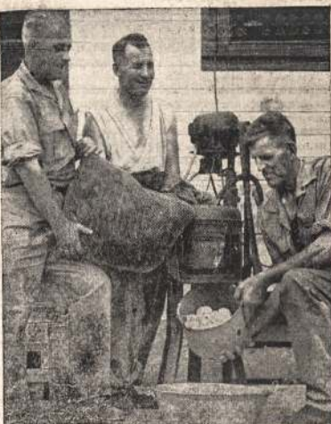
Bulvės skuti kareivini yra labai "nugarbingas" darbas. Viršrinkai dažnai baudžia kareivius vartydami bulvių skuti. Be eilės, už mažesniu nusizengimus. Bet Kanados kareivinė bulvių skutimas tampa visai skirtingu. Armija gavo daugelį mašinių bulvėms skuti. Atvažde matote kanadiečius kareivius skutant bulves mašina.