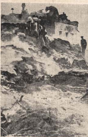
Kur naziai užėina, ten jie randa tikrai griuvėsius. Užėmia Sovietų teritorijos nesuteiki naziams jokios materialios naudos. Štai vaizdas, paduotas pačių vokiečių, to ką jie randa Sovietų žemėje.

J. Indriunas 665 Queen St. W. Tel.: EL. 3630 Toronto, Ont.