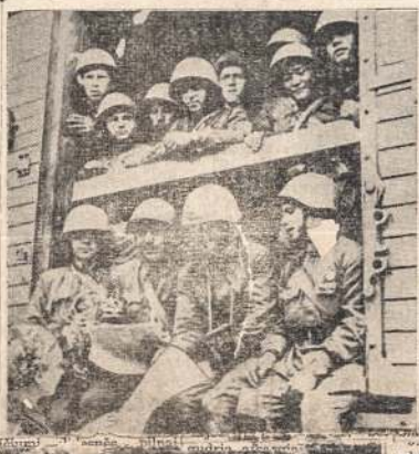
Raudonosios Armijos kariai vyksta į frontą kovai prieš nazius. Vėliausiomis žiniomis iš fronto ir kitių sritių atspindi juos mergina, laikraščių pardavėja.

Po trumpos draugo pirmininko J. Urbanavičiaus įžanginio kalbos, pirmą kartą įvyko pirmasis rugpjūčio mėnesio mitingas. Rugsjūčio mėnesio mitingas, kuris vyko prieš 10 mėnesių, buvo pirmasis lietuvių mitingas, kuris vyko prieš 10 mėnesių.