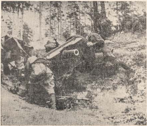
Raudonarmiečiai gaben kamuolė į kitą poziciją. Suomai ir vokiečiai pripažįsta, kad Sovietų artilerija labai gera ir taktikai šauda.

Kaip buvo galima Rusijos armijos jėgą išlaikyti paslaptijė? Tas tikrosios jėgos nežinojimas užsienyje sukėdė daug spėjimų ir netgi privedė prie netiesingų spėjimų. (Nukelta ant 6 pusl.)