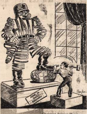
Christian Science Monitor