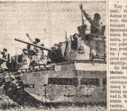
Pirma Kanados sarvuota vienietė Anglijoje šve manevrų. Jau trys kanadiškos divizionos Anglijoje. Jos laukia to laiko, kada reiks eiti į kovą del galutinio Hitlerio gaujų su- trinkinimo. Kitos divizionos Kanadoj. Dabar baigiamą organizuoti šešta divizija. Kalbama, kad bus įvesta konskripcija, jeigu bus atidarytas kitas frontas.