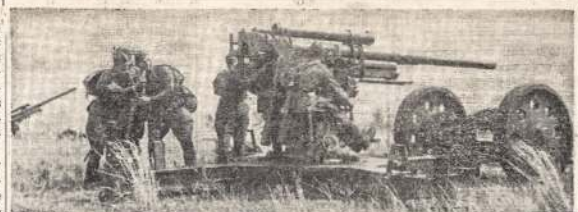
Sovietų Sąjungos artileristai šūdią granatas priešui. Sovietų artilerija atsakomąja už sudaugymą tūkstančių vokiečių tankų.