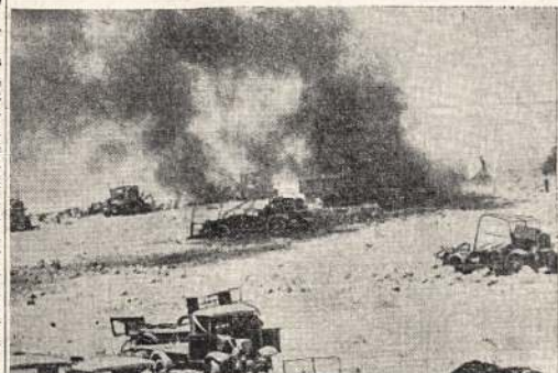
Vaižai iš karo Libijoj. Tankai, sunkvežimiai ir kiti vežimai guli sudaužyti vienas prie kito. Naziai tenai neteko šimtų tankų, dar daugiau kitokių pabūklų. Be abejonės, pražūdė nemažai tankų ir kitų pabūklų ir Britanija, Priešas gynėsi kiek tik galėjo.