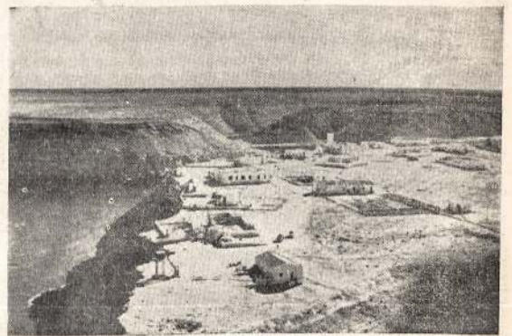
Bardis, vienas iš stambesnių Libijos miestų prie Viduržemio jūrų. Dabar jis antru kartą perėjo į britų jėgų rankas. Reikia manyti, kad na žiai ir italai jo nebomatys.

KIRKLAND LAKE. — Teek priemiesčio rinkimus laimėjo aukso kasėjų streiko palaikytojai, įskaitant ir viršaitį.