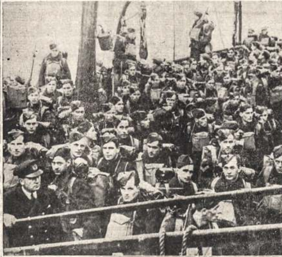
Ready to disembark field artillery, service units and air men arrived at a British port recently. It was the biggest movement of troops overseas from Canada since the start of war. Grim and eager, the troops swarmed over the decks of the huge, gray transports as they entered the port, glad to be near scene of action; impatient to meet the enemy.

There is every reason to believe that your silence bodes ill for the forces of democracy in America. How else can one think when we recall the declaration of war