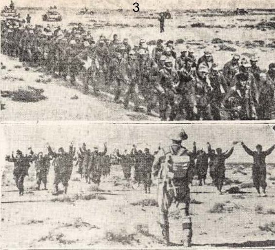
Vokiečių ir Italų belaisviai Libijoje. Musolinio ir Hitlerio padėdis Libijoje dar prastesnė, negu rytiniame fronte. Jų armijos Libijoje baigiamos mušti.