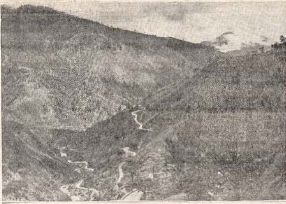
Amerikos ir Filipinų kariuomenė pasitraukė į kalnotas ir sunkiai pereinamas vietų Luzon saloj. Bet japonų jėgos, užėmusios Manilą, turi nuo 250.000 iki 300.000 vyrų ir sulaukyti jas bus sunku.