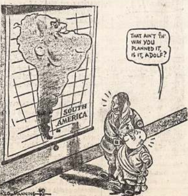
— Salt Lake Tribune