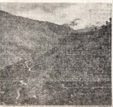
Japonai, dar senai bando sumušti generolo MacArthur'o kariuomenę Batān pussalyje, bet be pasekmių. Amerikiečiams ir filipinams daug padeda kalnuotos vietos, kaip kad šiame paveiksle matoma.

Daugelis, kurie dėl per-merkios sveikatos netliko veikliai karo tarnybai, neat- laidžiai prašė priimti juos į lietuviškąjį dalinį Raudonosios Armijos ir su sąmąstos nuėjo sau, kada buvo at- (Nukelta ant 5 pusl.)