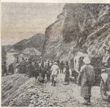
Kadangi japonai jau nukirto gelžkelį iš Rangoono linkui Burmos keliu, tai dabar kinai daro kitą kelią, kad būtų galima gabentis reikmenas iš Indijos. Atvaizdė matote kinius prie to kelio darbu.

„Per sienos plyšelį, aš pamaciau vyrus belaisvius su-