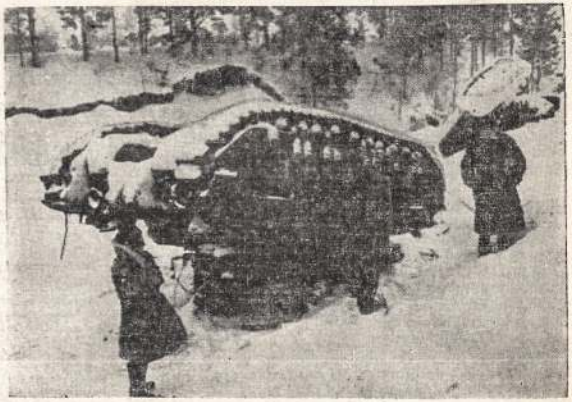
Nazii tankai užverte kovas aukštyn. Juos apvertė Raudonosios Armijos kauloės. Reporterai praneša, kad Sovietų artileristai labai gerai ša do. Taipgi vadinamus vokiečių "pilbakstius" paverčia į dulkes.

Darbininkai bus imami konskripcijai ir aptarnavi- mo reikalams.