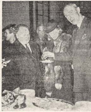
Sovietų Ambasadorius Litvinovs kartu su Britanijos ambasadorium Hilifaksu ir kitais svečiais laike Raudonosios Armijos 24 metų sukaktuvių minėjimo Sovietų ambasadoje Vašingtone. Armijos ir Laivyno oficialai buvo užkėmę ambasadą.