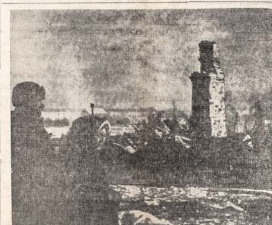
Hitlerio gaujas ima pasitūtimas, kad reikia trauktis atgal Napoleono keliais. Už tai jos naikina viską, ką tik suspėja sunaikinti. Atvaizde matote valstiečius žiūrint į savo sunaikintus namus kaime, kurį sunaikino atstrauckdami naziai.

Oruo bent kiek pagerėjus, sakė jis, Britanijos bombieriai pradės atakuoti vokiečių fabrikus, prieplaukas ir kitus militarines vertes punktus. Bombieriai naudosią daug didesnes bombas. Jau dabar kai kurios bombos siekiančios dviejų tonų sunkumo, bet esą gaminama dar didesnių. Užpuolimai ant vokiečių okupuotose šalyse būsą dar dažnesni ir dar didesni.