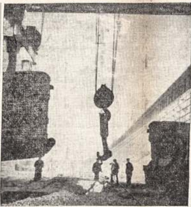
Stalino vardo metalurgijos fabrike Magnitogorske didžiulii katilai su išstarpintu plienu del tankų. Ir Hitleris negalį nieko jiems padaryti. Jie nepaisiekiami jo bomberiu.

LONDONAS. — Britanijos submarinai, savo torpėdomis ir iš kanuolių, Italijos ir Albanijos pakraščiuose nuskandino du didelius Italijos submarinus, du reikmenų laivus, šešius skūnerius ir motorinį laivą su kariuomene, kaip pranešė admiralitetas.