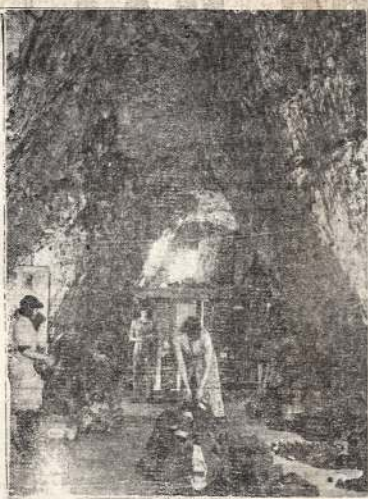
Hitleris, būdamas užimtas kova rytiniame fronte, nebėstena orlaivų bombardavimui Anglijos, bet jeigu ir turėtų kuo bombarduoti, būtų sunku sudaužyti orlaivius ir kitus ginklus gaminančius fabrikuos. Daug fabriky yra perkelta į pajemus. Cia matote orlaivų fabriky apieistoį kreidos mainoj.

Be abejonės, Hitleris noršų, kad Turkija prisidėtų i norėtų, kad Francija atiduotų jam savo laivus. Tik tai usimas, ar kas jo norų paisyks. Kol demokratijos dar nugalėtos, vilties nemustoja ir neutralios valstybės. Ju imas, tačiau, atrodo labai suristas su tolimesne karų. Jeigu Hitleriui pavyktų apturėti dar bent vieną stam laimėjimą, vokiečiai ir neutralios valstybės netektų garkaulio. Jeigu, žinoma, Hitleris gautų į kaly, tai jų zicija sustiprėtų.