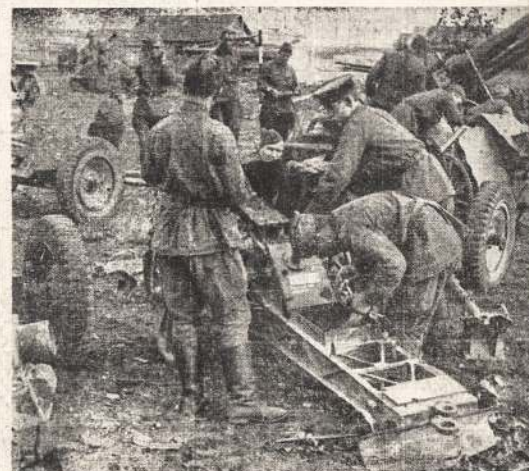
Raudonarmiečiai apžiūri iš vokiečių atimtus ginklus. Raudonoji Armija jau daug vokiečių ginklų paėmė, bet dar daug paims. Keliose vietose apsupos didelės vokiečių jėgos.

Britanijos vyriausybė siū- lo Indijai dominijos teises. Tuo tarpu Indijos vadai reik- sita reikalavimus, kad būtų duota Indijai pilna nepri- klausomybė ir nieko nelau- kiant.