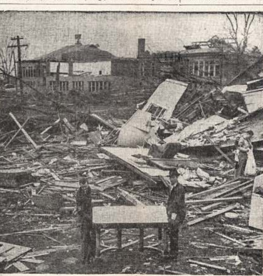
Keliuose pietinėse ir vidurvakarinėse Amerikos valstijose vėsula pridarė daug nuostolių. Šiame atvaizde matote tos vėtros darbo rezultatus Lacone, Ill.

— Labai atsiprašau, Jur-gi, bet aš negaliu to pada-ryti su gryna sąžine. Aš irgi buvau susižiedaves su ja.