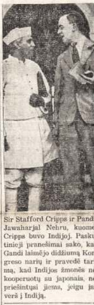
Sir Stafford Cripps ir Pandit Jawaharlal Nehru, kuomet Cripps buvo Indijoj. Paskutinię pranešimai sako, kad Gandi laimėjo didžiūmą Kongreso narių ir pravedė tarpo, kad Indijos žmonės nei kooperuotų su japonais, nei priešintųsi jiems, jeigu įliverš į Indiją.