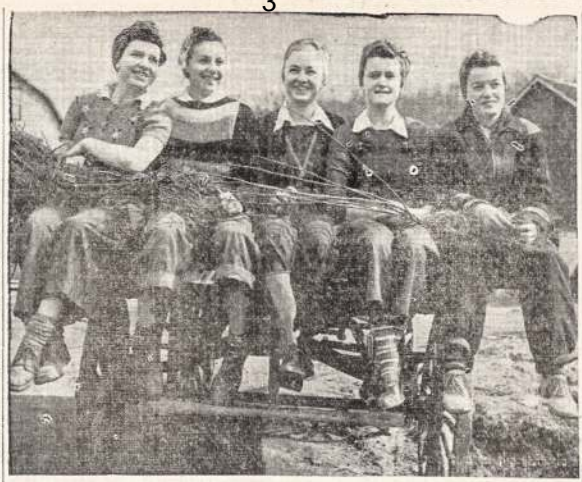
Ontarijos Farmų Armijos narės išsisi. Nuo dabar joms darbo bus daugiau ir daugiau, kadangi laukų darbai prasideda visu smarkumu.

PADEKTI KANADOS RAUDONAJAM KRYZIUI SUKELTI $9,000,000