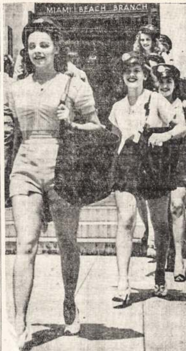
Esant stokai vyrų liaišų išnešiotų Miami Beach pašte, pagalbom pribuvo merginos. Bet atrodo, kad jos vistiek atsaisako nešioti paštorių kelesines.

470 College W., Toronto Telefonas: RA. 3924