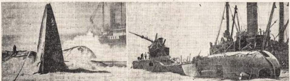
Amerikos submarinas Squallus, kuris matomas karėj snuki iškėis iš vandens laike jo iškelimo iš jūrų dugno prie Naujosios Anglijos 1939 metais, dabar vadinas Salfirsh. Jis jau nuskaudino vieną japonų naikintuvą, o prie to, vieną kruizerį ir vieną orlaivinę nešį paeidė. Britanijos submarinas, kuris matomas dešinėj ir kuris taipgi buvo nuskaudė 1939 metais, dabar jaa ne Thetis, o Thunderbolt. Jis taipgi atsismėjo.