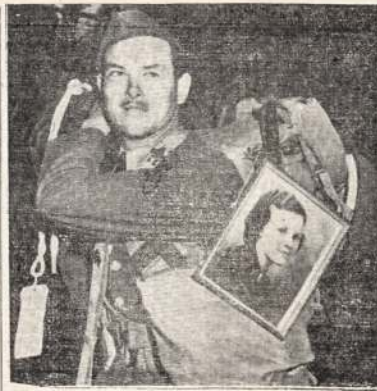
Kada vyras nešiojasi su šavim savo merginos paveikslą ir armijon išėjęs, jįs galite būti tikri, kad jis myli ją labai karštai. Cia matote vieną iš tokių. Tai Amerikos kareivis. Jis apleidžia laivą, kuriuomi atvyko į Australiją.

Tuose abiejose laivuose buvo viso 129 žmonės. 111 iš jų išgelbėta, jų tarpe viena moteris su vaikučiu. Sėptyniolika skaitomi dingusiai ir vienas mirė nuo nušikamavimo vandenyje.