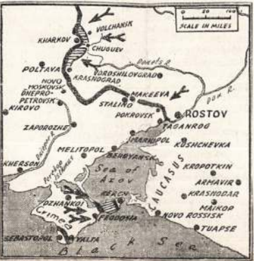
Šis žemėlapis parodo Raudonosios Armijos ofensyvą pa sekmes per pirmas kelias dienas Karkovo fronte.

Komanduojuomas maršalo Fedoro von Bock, nazių armijos vėžiai link Izumo, an Doneco upės ir gelžkelio link Rostovo, ir linkui Barvenkovos.