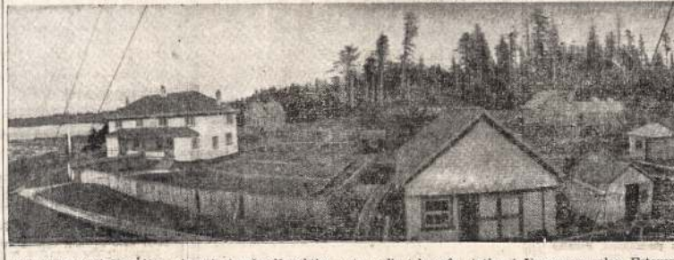
Kiek laiko atgal Japonijos submarinai apšaudė nakties metu radio telegrafą stotį ant Vancouver salos, Estevano išsikisimo. Siame atvaizde matote keletą pastatų prie tų stoties.

— Aš matau, kad suknelė senai išėjo iš mados, — įterpė leidė, — bet aš nemaniau, kad bulius galėtų tą pastebėti.