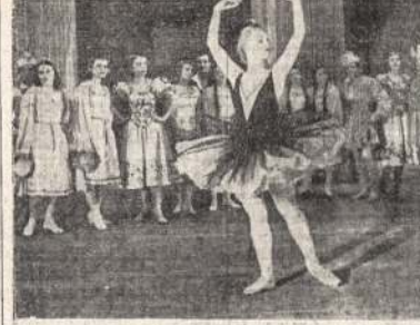
Nepaisant to, kad karas, kultūra ir menas Sovietų Sąjungoj eina savo keliu. Atvažiuo matote populiarūs Sovietų Sąjungos šokėjus šokant "The Swan Lake."