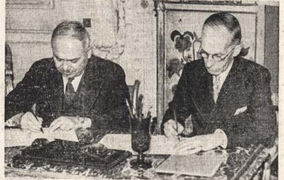
Sovietų Sąjungos ambasadorius M. Majskis ir Kanados Aukštasis Komisionierius Hon. Massey pasirašo sutartį Londone, Anglijoje. Ta sutartimi einant, Kanada įstigs savo ambasada Sovietų Sąjungoje, o Sovietų Sąjunga Kanadoje.