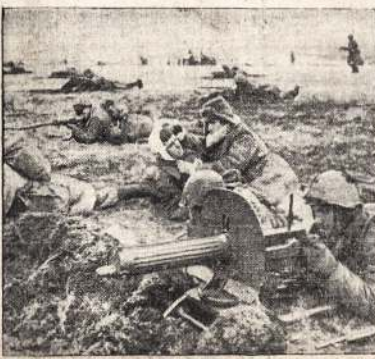
Stiprūs kareiviai turi kovoti savo priešus. Čia matote raudonarmiečius laike atakos pietiniame fronte są pavaršį. Kartu su kareiviais eina ir slaugė, kurių viena matyti centre. Ji aprūša sužeistą kareivį.

Sovietų spauda išėjo sąjungininkus, kad jie nepasivėluoti su antro fronto atidarymu, nes šie metai yra