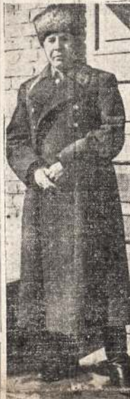
Maršalas Timošenko, sumaniusias Sovietų karo vadas, kuriam tenka dabar vadovauti toms Raudonosios Armijos dalims, kurios kovoja su besiveržiančiais vokiečiais Dono fronte.