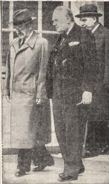
Sovietų Sąjungos užsienio reikalų komisarą Molotovą, Britanijos ministrą pirmininką Vinstoną Čiorčilis ir Sovietų Sąjungos ambasadorių Matais po pasirašymo sutarties tarp Sovietų Sąjungos ir Britanijos, kurį rėš šias abi šalis ant 20 metų.

Ar buvo kas nors panašaus nutarta tu "rimtųjų" organizacijų "kongrese," kuris buvo suauktas anksčiau? Nieko panašaus. Pasipatė už kojų, pasiriejė tarp savęs parvažiavo namo susitkę į kibenes neprimtas rezolucijas.