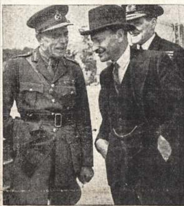
Leitenantas Generolas A. L. McNaughton ir majoras Atlee, Britanijos kabineto narys, kalbasi laike inspekcijos Kanados inžinierų budovajamo didžiulio aerodromo. Gen. McNaughton numatomas antro fronto komandierium.

Ministeris pirmi n k a s King pranešė, kad užbaigiant sesiją jis veiksiausiai paskelbs, kas bus Kanados ambasadorius Sovietų Sąjungai.