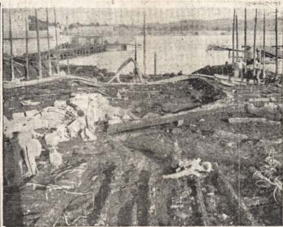
Neseniai Midlande, prie Georgian įlankos, gaisras sunaikino laivų statymo įmones ir du jau baigiamus statyti karo laivus. Atvaldė matote ugnies nuteriotą pakraštį, kur buvo laivų statylos. Nustoliai siekia $900,000.

Parlamentinė Britanijos sistema, sakė jis, neatliko tiek del išvystymo industrijos ir civilizavimo Britanijos žemijų per 250 metų, kiek Rusija atliko kas 250 dienų per pastaruosius 20 metų.