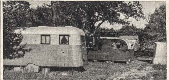
Karas pakeitė sąlygas ir toli nuo fronto esančioj Kanadoj. Kariška gamyba sutraukė daug darbininkų į industriją ir dėl to atsirado stoka namų. Daugelyje vietų darbininkai gyvena turistiniuose treileriuose, kaip šiame atvaizde matyti.