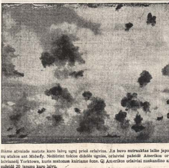
Šiame atvaizde matote karo laivų ugni prieš orlaivius. Jis buvo nutrauktas laike japonų stakos ant Midway. Nežiūrint tokios didelės ugnies, orlaiviai pažeidė Amerikos orlaivines Yorktown, kuris matomas kairiaime šone. Qi Amerikos orlaiviai nuskandino ar sužeidė 20 japonų karo laivų.