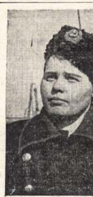
Sovietų Sąjungos moterys dirba tiek pat kaip ir vyrai, kad tik sulaukyti priešus, šios dvi moterys yra dvi iš daugelio moterų, kurios valdė ir aptarnauja laivus Amuro upėje.

no priima programą kovos prieš hitlerizmą, už išlaisvinimą Lietuvos iš po vokiečių