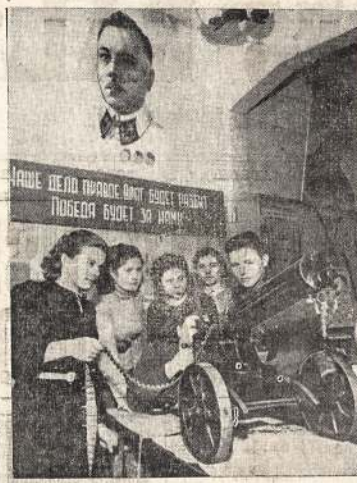
Šios Maskvos merginos mokinais kaip vartoti kulkovalgį.

Toks jų aiškiniams labai keistas. Sunku jų suprasti. Dabar, rodos, jau aišku, kad Kanada, dalyvaudama kovose už jūrą, gina savo interesus. Sėdėjimas namie ir laukimas iki priekai nugulės kitas, rodos, labai aiškiai sako, kad tai labai kvailas nusistatymas. Bet jie dar vis nemeta tokio nusistatymo.