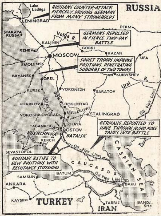
Šis žemėlapis parodo kur maždaug yra rytinis frontas. Į pietus nuo Rastovo naziai pataruoja laiku pasistūmė kiek pirmyn.