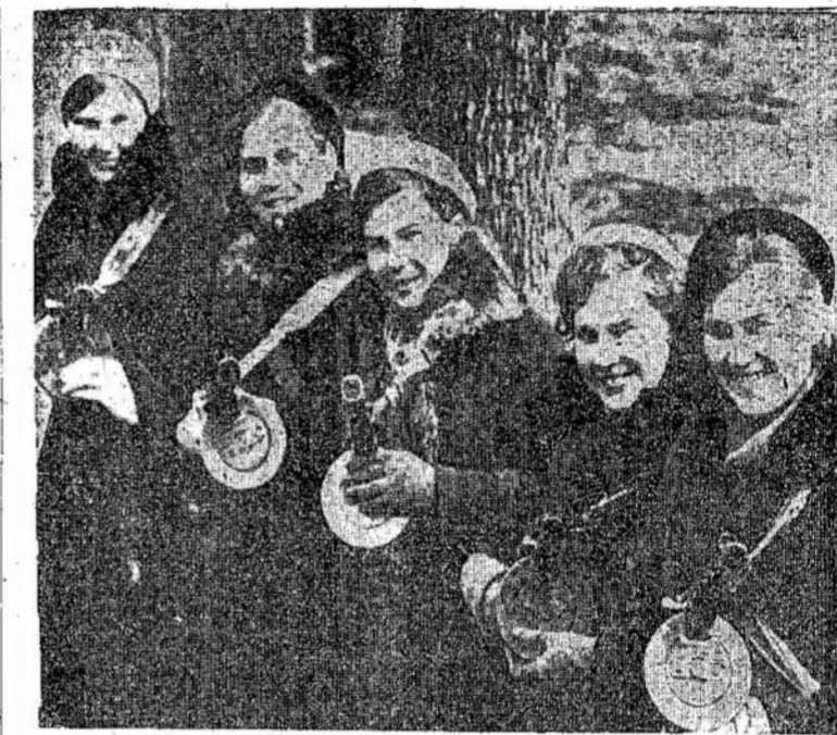
Jeigu Hitlerio blitzkrigas nešėdė Sovietų Sąjungoj, tai tik dėl to, kad visi tos šalies žmonės kovoja prieš savo priešą. Čia matote merginas, kurios automatiniais šautuvais gali iškloti pulką parašutininkų ar kitų priešų.

LONDONAS. — Vėl laimėgai atvyko į Britaniją daugiau Kanados armijos.