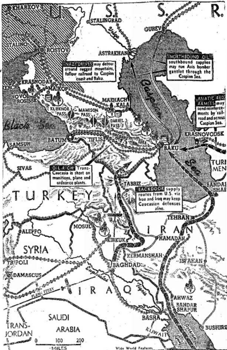
Kaukazas ir keliai, kuriais galima pristatyti Raudonajai Armijai pagalbą.