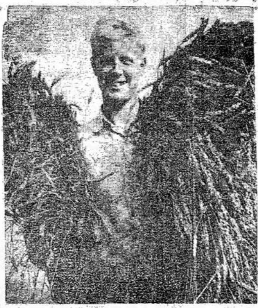
Gausingą gamtos suteiktą derlių suimti nuo laukų, reikia daug darbininkų. Čia matote jaunuolį su kvičėjų pėdais, gelbstint farmeriams nuimti javus nuo laukų.

Tokiam įtemptam momentui esant ir negalint sulaukti antro fronto atidarymo, be bejonės, kyla visokios mintys ir įtarimai. Tiems įtarimams didėti padeda tas faktas, kad visose šalyse aukštos vietose yra daug atžagareivių, kurie trukdo prisirengimui tai ofenzyvai. Pavyzdžiui, Kanadoje mes turime labai didelį bloką Kvebeke. Veik visi Kvebeko provincijos atstovai parlamente išstojo prieš pakeltimą mobilizacijos akto, kas buvo reikalinga pagreitimui Kanados prisirengimo prie tos ofenzyvos. Dėl to tai toks didelis Kanados žmonių susirūpinimas karo eiga ir reikalavimai, kad prisirengimas būtų vedamas visu tempu. Tai ne nepasitikėjimo reiškinys vyriausybei, o raginimas, kad ji nepaisytų trukdytojų.