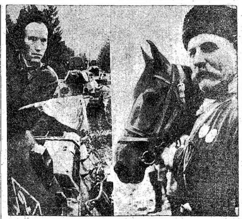
Agpynimui Stalingrado frontą traukia Sovietų tankai ir pasiryžę tankistai atremti priešų galybę. Dešinėje matomas kankas, praeito karo veteranas, už kovas su vokiečiais apdovanotas medaliais, dabar savanoriu stoji į Kaukazo gynyvą eiles. Priešas puolimui ant Stalingrado yra pastatęs 800,000 moderniškiausiai apginkluotos kariuomenės, bet lig šio laiko jo visos atakos buvo atremtos, su didžiausiais nuostoliais, kuriuos padarė narsūs Stalingrado gynyjai.

TORONTO. — Ontarijos vyriausybė praneša, kad neuzijol bus patiekti Ontarijos seimeliui priimti įstatymus, kuris garantuos darbininkų unijines teises.