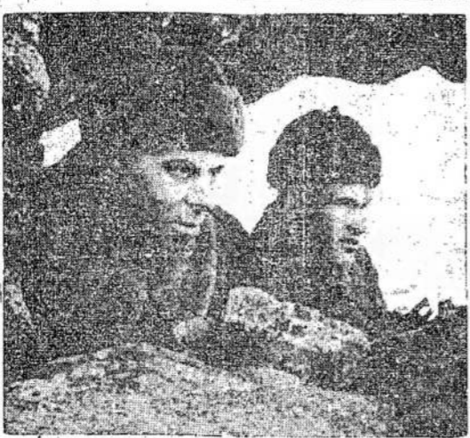
Raudonarmiečiai observacijoje Murmanskio fronte. Savo aštriu žvilgsniu jie temyja priešų puse, kad kiekviena jų pajudėjimą žinotų Sovietų artilerija ir savo ugnimi juos taikliai skintų, jei tik bandytų eiti pirmyn.

Kada vokiečiai sugrižo su naujomis jėgomis, buvo priėmus pagalbą ir pozicija buvo išlaikyta.