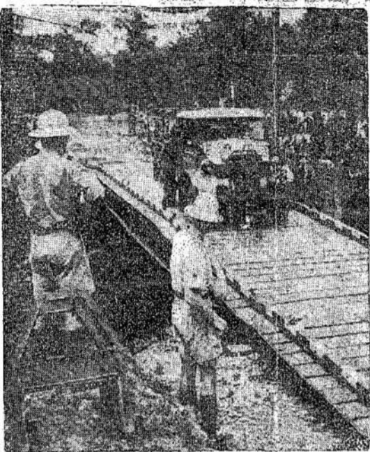
Tikėtai, ar ne, bet šis tiltas buvo pastatytas per 17 minučių. Juo gali, tačiau, važiuoti sunkiasis trokai ir ki-