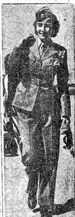
Moterys gerai atrodo ir karinėj uniformoj. Štai Mrs. Nancy Love, Moterų Pagelbinio Ferry Eskadrono komandierė, apsirengusi nauja moterų lakūnių uniforma. Šią uniformą jos nešioja tik ant žemės esant.