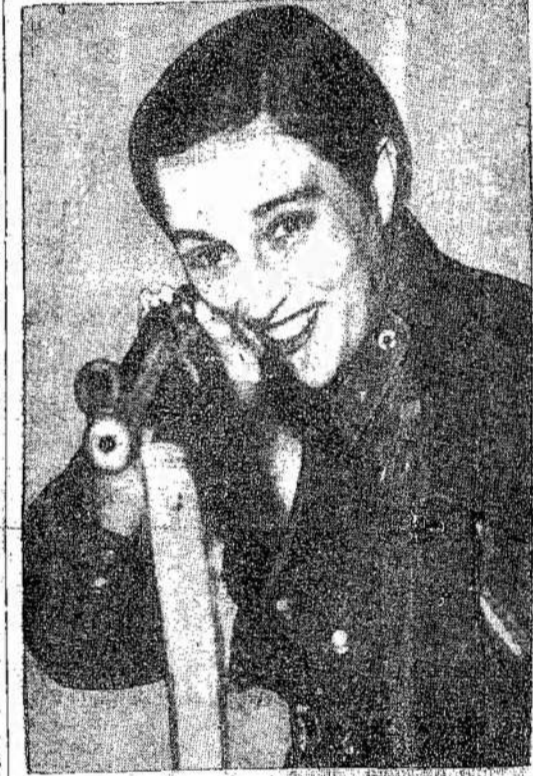
Leitenantas Liudmila Pavličenko, kuri yra nušūsi 309 nazius. Čia ji matoma demonstruojant fotografam šautuvą, kurį jai padovanojo Ontarijos premjeras Mičelis Hepburn, masiniame mitinge Toronte, kuriame dalyvavo 18,800 žmonių, ir kuris buvo sušauktas parėmimui reikalavimų atidaryti antrą frontą.

Liudmila Pavličenko. Skaitykit ir Platibit LIAUDIES BALSAS