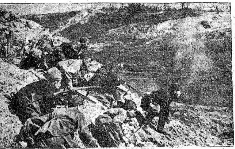
Stalingradas virto kapais nazių gaujoms. Tūkstantai nazių padeda galvas kasdien stengdamiesi paimti Stalingradą. Stalingradą sunku

Vokiečiai puolė konvojų visomis jėgomis, bet jiems tas kainavo keletą dešėlių orlaivų.