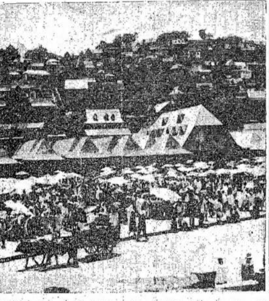
Madagaskaro sostinė Tananarive, kurią jau užėmė britų armija, kad neadeisti įsigalėti japonams. Lavalo vyriausybės pastatyti val-

MASKVA. — Hitleriui atakos ant Stalingrado kainavo jau 48,000 nazių per 26 dienas. Apart to, jis neteko 1,250 tankų. Raudonoji Armija ir Stalingrado darbininkai taip greitai nazius skina, kad vokiečių komanda priversta sutvirtinimus gabenti orlaiviais.