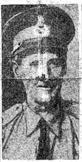
Generolas Montgomery, briantiskas britų jėgų vadas Libijoje, kurio vadovybėje Romelis gavo skaudžius smūgius.