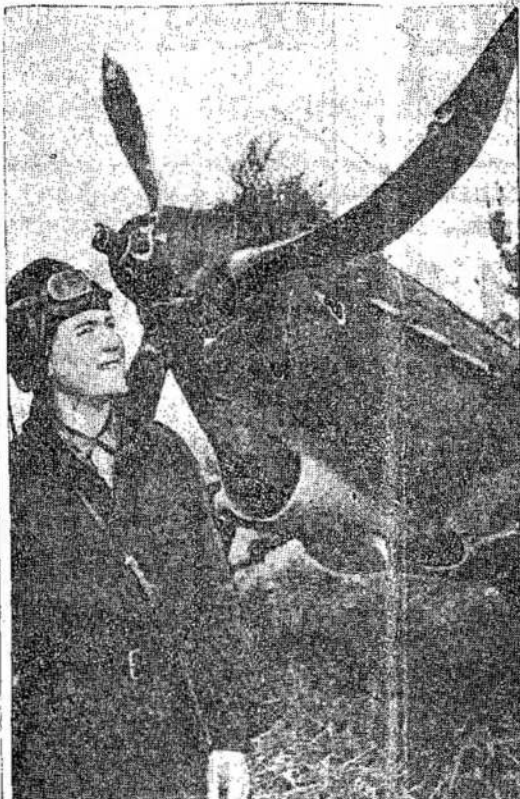
Sis sovietinis lakūnas stovi dieną jis numušė kitą nacijų vokiečių orlaivio, kurį orlaivį. Tokių lakūnų Sovietų numušė jis pats. Tą pačią Sąjungoje yra daug.

To viso akyvaizdoje reiktų mums gėdytis ir kalbėti, kad reikia stumti rusus į karą. Kaip tik priešingai. Rusai gali pasakyti mums, kada gi jūs pradėsite kariati?