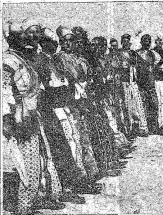
Neseniai paskelbė karą Ašiai įmatote būrį Irako kariuomenarabų valstybėlė Irakas. Cia nės pasirengusių iškilmėms.

Milijonai žmonių, jaunų gražių žiedų, atidavė savo gyvybę, ne tam, kad vietoj Hitlerių, Musolinijų ir kitų barbarizmo vadų būtų pastatyti kiti fašistai. Prezidentas Ruzveltas ir kiti vadai pasakė, kad po šio karo turės būti kitai, negu po pereinamo karo. Po pereinamo karo buvo padaryta ne taika, o paliaubos. Po šio karo bus įsteigta taika — žmonių taika. O žmonių taika gali būti tik tuomet, kada patys žmonės valdysis.