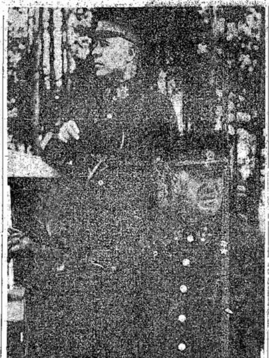
Sovietų maršalai Timošenko, Vorosilovu, Timošenko, kaip ir Žukovas. Žukovas vadova-vokiečiai skelbia, dabar vaivo Leningrado išvadavimo dāvauja Velikije Luki frontofensyvai, kartu su maršalu tui.

Be to, dar neužmirškime, kad Sovietų Sąjungoje yra nemažai pabėgusių nuo žvėriškų nacių ir mūsų brolių ir seserų lietuvių, kuriuos Sovietai globoja. Sušelpdami Sov. Sąjungos žmones, kartu sušelpsimė ir savo brolius ir seseris. Prisdėkite, kas kuo galėdami, finansiniai ar darbu ar su dovanomis. Moterys norinčios prisidėti su darbu gali nusipirkti savo iš-