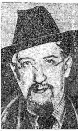
Carlo Tresca, 58 metų amžiaus italas antifasistas, antifasistinio laikraščio redaktorius, kuris neseniai buvo nušautas ant Fifth ave. New York. Matomai fasistų darbas.

Valstybės sekretorius peržiūrės Intencijos Deklaraciją. Jis turi pilną galią priimti ar atmesti aplikaciją. Jeigu jis priims, tai deklarantas gaus oficialų pakvitavimą. Tą pakvitavimą bus pirmasis popieris. Vėliau jis galės paduoti aplikaciją del paskutinių popierių. Laikas, kada bus galima paduoti aplikaciją del paskutinių popierių, priklausys nuo to, kaip ilgai jis bus išgyvenęs Kanadoj. Paskutiniai popieriai negali būti suteikti kol asmuo neįgyvenęs Kanadoj penkių metų. Deklarantas, išgyvenęs Kanadoj tris me-