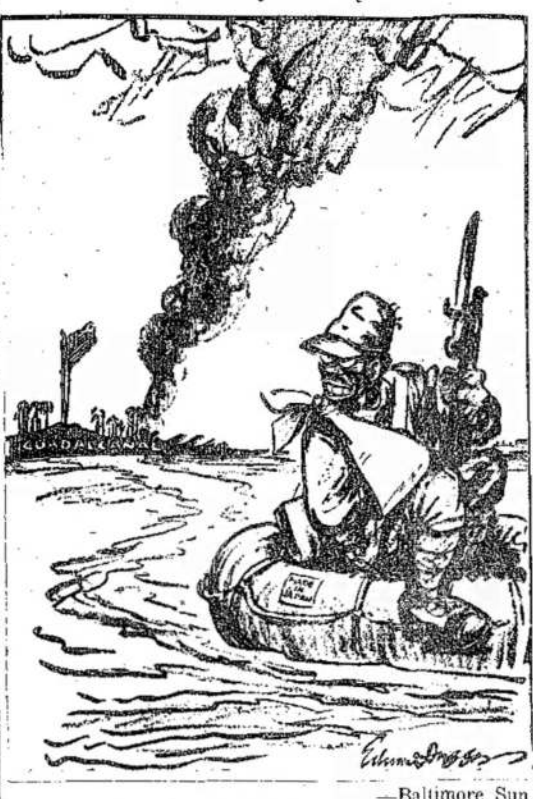
— Baltimore Sun