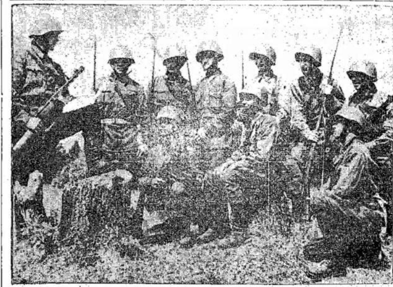
Raudonoji Armija šią savaitę mini savo 25 metų sukaktu- ves. Lietuvių vardas bus vi- suomet suristas su Raudono- sios Armijos atsieikimais. Raudonosios Armijos eilėse kai tikstančių lietuvių. Ši- me atvaizde matote grupę lietuvių raudonarmiečių, išsi- lavinusių su Raudono- sios Armijos atsieikimais. Raudonosios Armijos eilėse kovoja desėt- kovon.