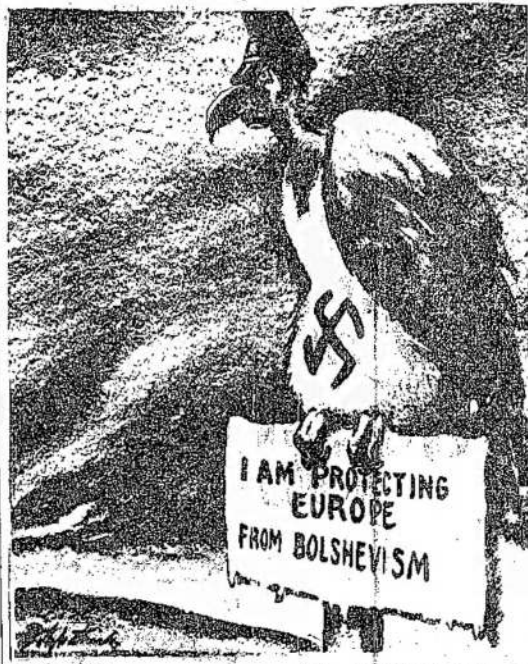
Fitzpatrick, St. Louis Post-Dispatch