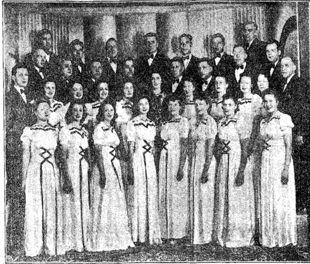
Bangos choras, kuris šį šeštadienį dainuos savo koncerte Labor Lyceum salėje, 346 Spadina Ave.

savinu šią dieną klausimų ir perrinkimui antihitlerinio komiteto.