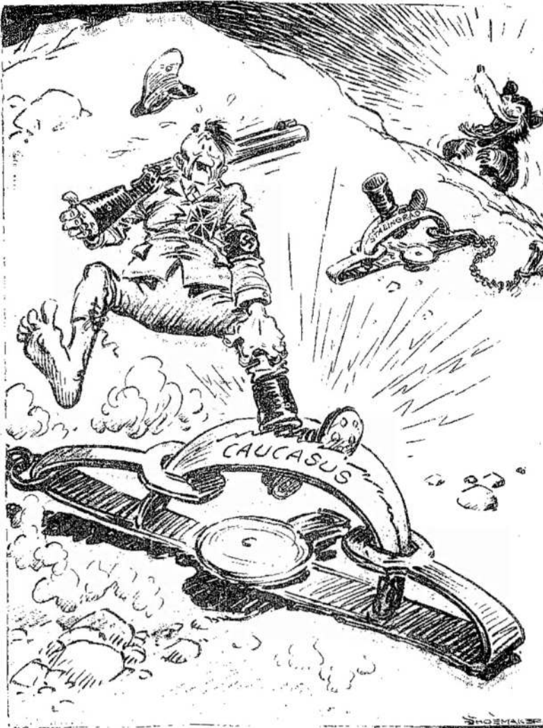
TAI TAU MŪŠŲ MEDŽIOTOJAS!

Nepasitenkinimas vyriausybe ir tais darbiečiais, kurie įeina į vyriausybę, kyla, žinoma, dėl to, kad buvo daug žadėta, o kai reikia įrodyti darbas, tai atsisakoma. O Britanijos žmonės norėtų matyti prižadus vykdančios nors mažaime laipsnyje.