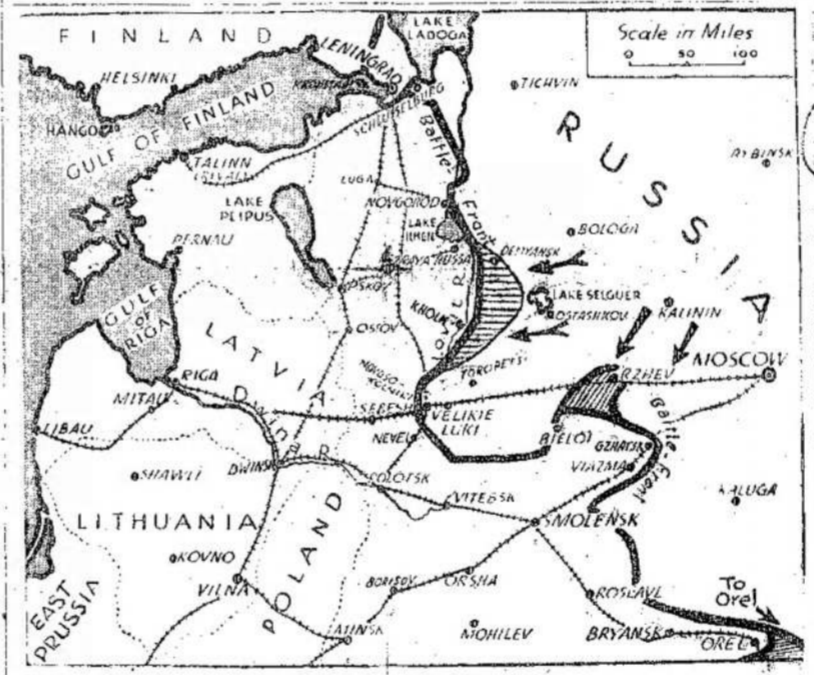
Šis žemlapis parodo, kur maršalo Timosenko jėgos muša vokiečius. Rėvo atėmimas, kaip matote, atliu-

suoja labai svarbų geležkelį į Maskvės linku. Vėlikėje Luki, o iš Vėlikėje Luki — linku Rygos. Galimas daiktas, kad dabar Timosenko bandys atkirsti vokiečius iš taurė nuo šio geležkelio ir sunaikinti juos tenai.