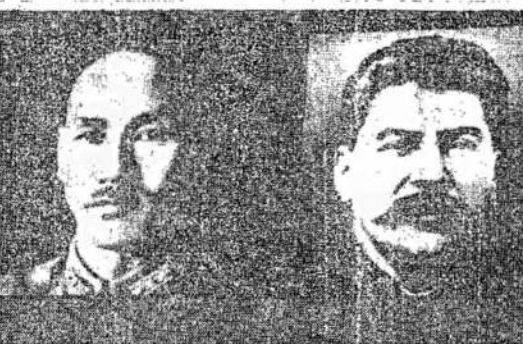
Jungtinių Tautų vadai: Čiorčilis, Ruzveltas, Čiangkaišas ir Stalinas. Šitie jų paveikslai kaboj prie Toronto miesto valdybos namo. Tuoj pat Pergalės Paskolos Toronto komitetas nori pasakyti detroitiečiams, kad šis karas yra visų Jungtinių Tautų karys ir kad jeigu mes norime, kad Kanada atliktų savo pareigas, tai mes turime pirkti paskolos bonus. Karo veimui reikalinga daug pinigų. Kiekvieno kanadiečio pareiga remti ataką.