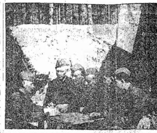
Lietuviškojo tautinio Raudonojo Armijos junginio koncerto metu.

Jie apginkluoti keturiomis kanuolėmis arba 12 kulksvaisdžių.