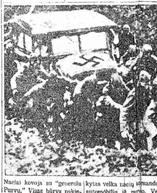
Naciai kovoja su "generolu Purvu." Visas būrys pakinkytas velka nacių komandos automobilių iš puvio. Veikniausiai nesimorėjo šaukti nei "Heil Hitler."

Lygiai tokius išvedžiojimus darė Italijos fašistai, Vokietijos naciai ir Japonijos imperialistai. Tais išvedžiojimais gyvenant ir buvo užkurtas šis karas. Musolinis kalbėjo apie reikalingumą ekspansijos, Hitleris kal-