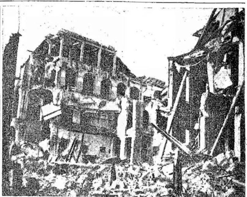
Kada Musolinis tempė Italiją, dabar gi britų ir amerikiečių bombieriai lygina jo fabriklus pačių italų ir pasiųstas į neutralią valstybę. Štai jam kolonijų, daug kariuomenės, britų atakos ant Turino. Šis "eit su vėlnu obuoliauti!"

LONDON. — Francūzų komunistų laikraštis L'Humanite išleido jau 200 numerių, nepaisant to, kad jis leidžiamas slapta, ir kad jau kelis kartus jo redaktorai buvo sučiupti ir nužudyti. L'Humanite begalėstingai maskuoja Francijos Kvislingus, Lavalių ir kitus, už jų pastangas padėti naciams. Už tai priešai perskioja ir jau tris redaktorių nužudė. London. — Naciai Kaukaze atstumi 20 mylių. R. A. užėmė Krimskąją.